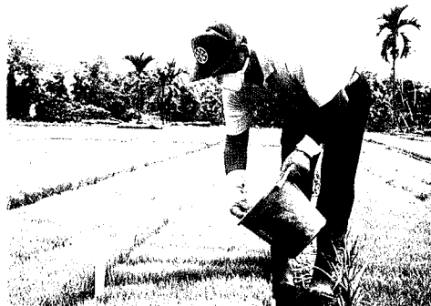
圖 2. 育苗箱施藥防治水稻水象鼻蟲 Fig. 2. Insecticides are applied to nursery boxes to control rice water weevil.