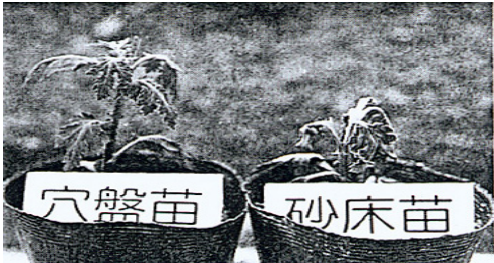
▲ 穴盤苗與砂床苗種植了三天候之生長差異， 試驗結果得之穴盤苗田間生長約可快 7~10 天