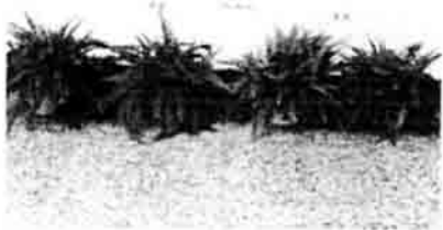
圖二、潮汐灌溉(淹灌)及噴灌對波斯頓蕨盆栽生育之影響。 Fig.2 The effect of ebb-and-flow system and spray watering on the growth of Nephrolepis exaltata cv. Bostoniensis .