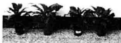
圖一、潮汐灌溉(淹灌)及噴灌對白鶴芋盆栽生育之影響。 Fig.1 The effect of ebb-and-flow system and spray watering on the growth of Spathiphyllum spp..