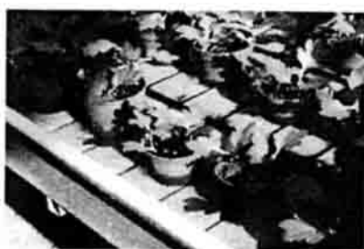
圖三、潮汐灌溉之停滯水分高度約 2.5 公分。 Fig. 3 The deep of water was about 2.5 cm on the tray of ebb-and-floe system.