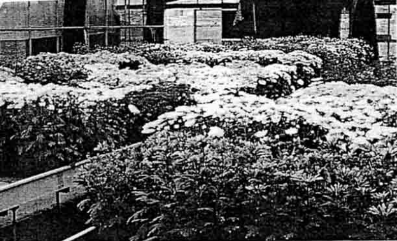
潮汐灌溉系統下的盆菊生產。

境的污染結省水資源，以此系統生產多花型盆菊在株高上較手澆及滴灌高，展幅、花徑方面的結果也有相同的趨勢，可生產高品質的產品值得推廣利用。