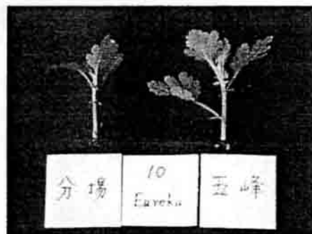
不同海拔高度生產的插穗之比較。

，主要為有效水養份供給較少所造成。以點滴灌溉及潮汐灌溉栽培盆菊可自動化進行澆水的工作，節省澆水的人工，但在點滴灌溉上需要注意水質以避免點滴管的阻塞，另外滴灌及潮汐灌溉在澆水時也可透過肥料稀釋器同時進行施用液體肥料。潮汐灌溉重複使用灌溉用水可避免肥料對環