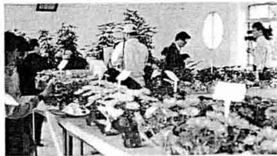
各種不同的盆菊品種評選展示。

中在農曆年前，雖然有多樣化、高品質的盆花但除過年前夕外，在其他時間出貨不易、價格低廉；探討此問題之際，我們希望相關單位能多多參考世界各地舉辦大型的菊展或高品質競賽，展示各具特色的品種、菊藝盆景、造型菊及菊花的佈置利用方式，以提高人們賞菊的情趣及水準，進而改變傳統對菊花的刻板的觀念。