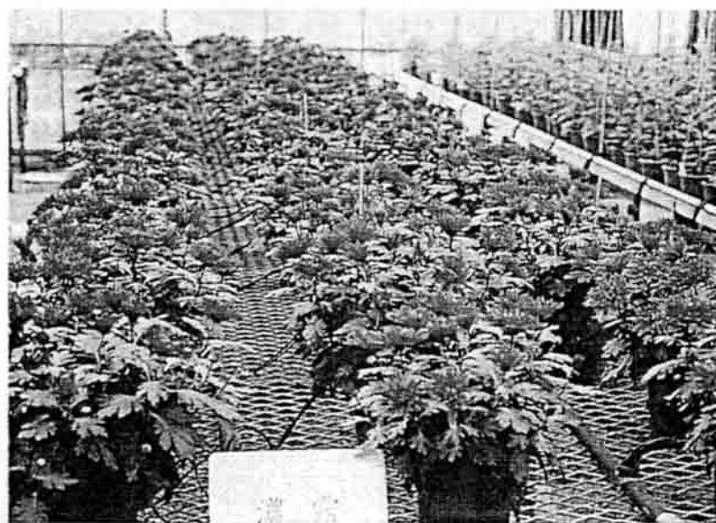
自動化點滴灌溉系統下的盆菊生產。

人工澆水及噴灑灌溉為盆菊傳統的供水方式，但盆菊到生育的中後期葉片已覆蓋整個盆面水份不易滲入土中，造成大量的水份留失及水資源浪費；除此之外以人工澆水及噴灑灌溉供水在盆菊的外觀上其株高較矮，花徑也較小