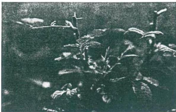
● 摘心修剪可促使迷你玫瑰快速成盆

消費者買回去欣賞之迷你玫瑰盆花，最好放置在陽光可照到之地方，水分勿過潮濕，一般欣賞2~3週後即可結束觀賞壽命，若有興趣有栽植者，可移出栽植於地上作為花壇植物，亦是不錯的方式。