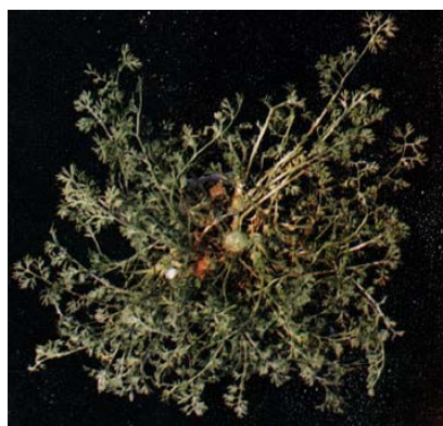
附表一 台灣推薦用于雜糧作物之殺草劑