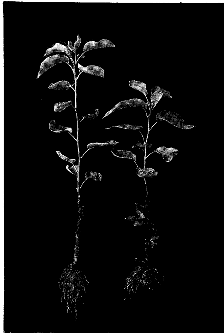
圖 2 . 已健化之接插苗之圖示

Fig.1. Illustration of the grafted portion of rooted stion was fused