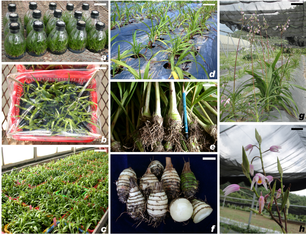
圖一、臺灣白及種苗培育、田間栽培、假球莖及花形態。