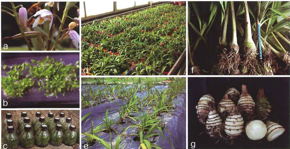
圖二. 台灣白及種子無菌播種、繼代培養、移植出瓶、田間栽培與假球莖收穫 a. 台灣白及花朵與蒴果型態 b. 種子於培養基上發芽形成小苗 c. 瓶苗於溫室馴化 d. 移植出瓶 e. 植株於田間栽培 f. 及 g. 田間收穫之植株與假球莖

藥用保健作物市場快速成長，結合現代生物技術，如 DNA 分子鑑定、植物組織培養技術、蛋白質表現等，將可在現有基礎上，提昇其品質與產品價值。