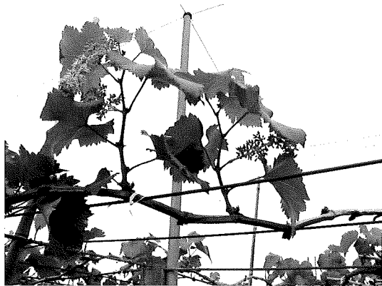
樹體營養不足，其新梢伸長不良將影響果實肥大及品質，應提早補施氮肥