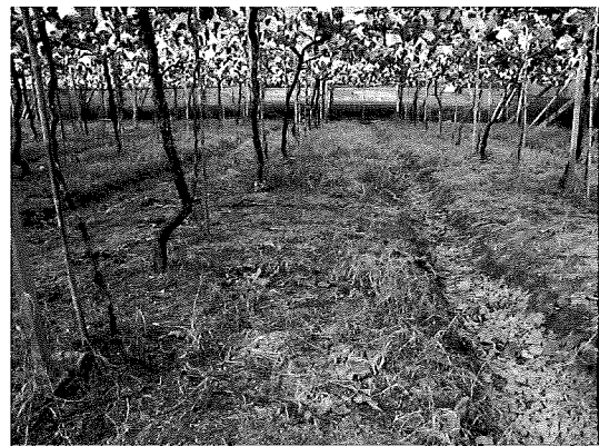
長期濫用殺草劑，會影響根系活力而降低果實品質