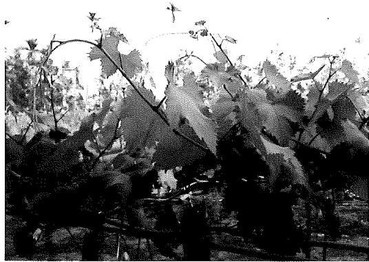
土壤氮肥含量高，造成新梢生育過強，其頂梢下垂而節間長