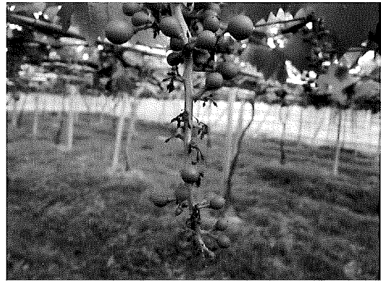
俗稱的“流花”乃因新梢生育太強，造成營養競爭而影響花穗期的著果率