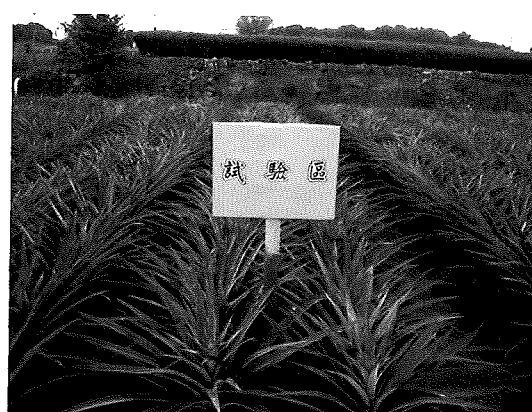
鳳梨合理化施肥示範區生長盛況