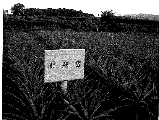
鳳梨農友慣行施肥對照區之情況

一般植物所吸收各種營養元素之來源主要包括有空氣、水、土壤(介質)及肥料等，除了碳、氫、氧以外，大部份營養元素都由土壤礦物或有機質分解後釋出，才能被植物吸收利用，但沒有一種土壤(介質)能長期蓄積足量的各種營養元素供給植物生長之所需，所以適時的施用肥料以補充適量營養元素，即為栽培作物時必要手段之一。在農業經營過程中，進行合理化的施肥是農業永續經營之必要條件之一。本文探討鳳梨之合理化施肥，謹供日後農友應用之參考，如須進一步資訊或討論，請洽台中區農業改良場蔡宜峰，聯絡電話04~8523101轉311，或tsaiyf@tdais.gov.tw。