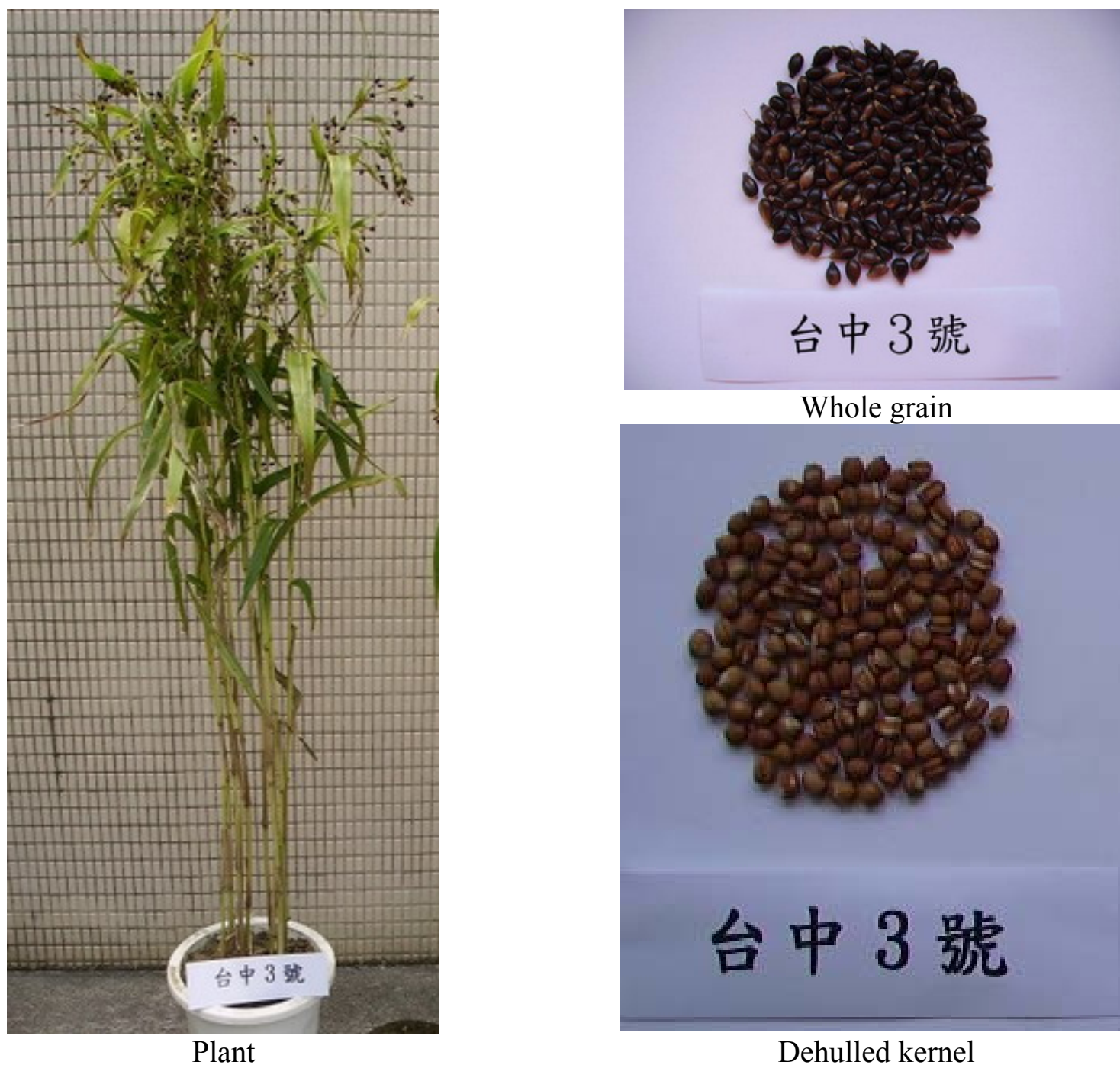
圖一、薏苡新品種臺中3號植株、籽實及糙薏仁。