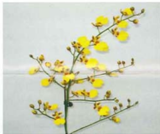
▲文心蘭4-50品系之花序