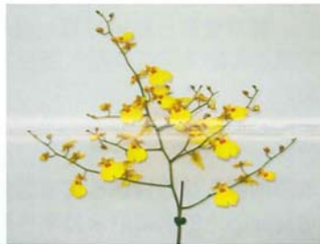
▲文心蘭蜜糖'Angel'之花序