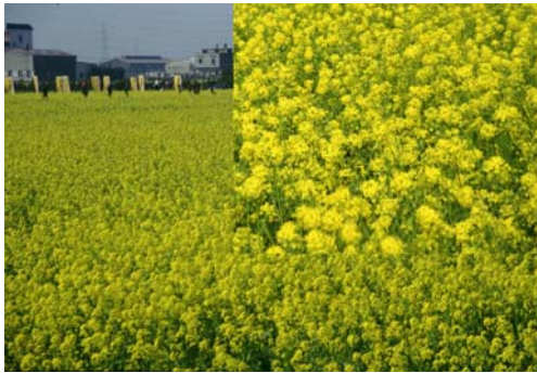
油菜開花生長情形