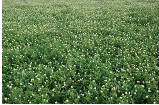
埃及三葉草生長開花情形