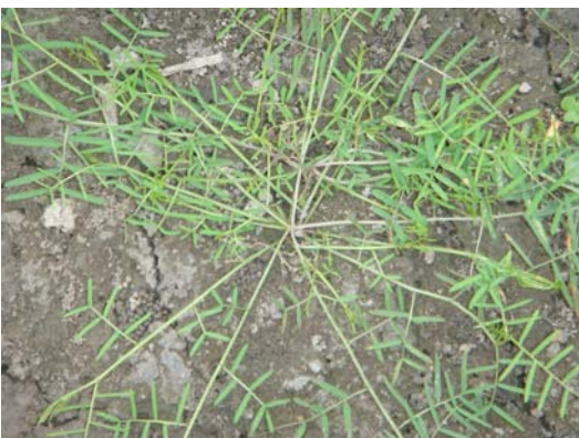
苕子植株呈放射狀生長