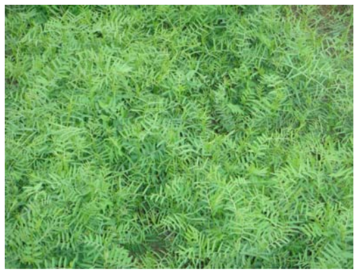
苕子初期生長情形