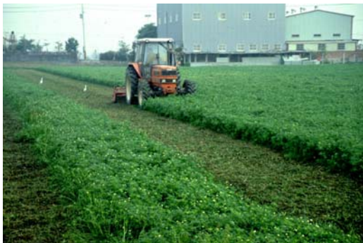
曳引機掩施綠肥情形