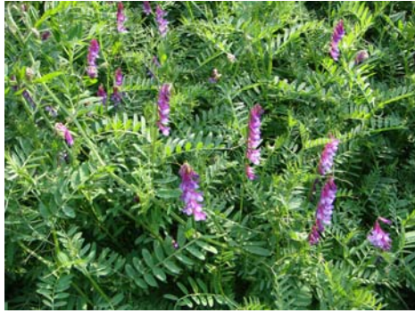
苕子開花生長情形