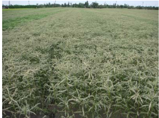
田菁遭受害蟲為害