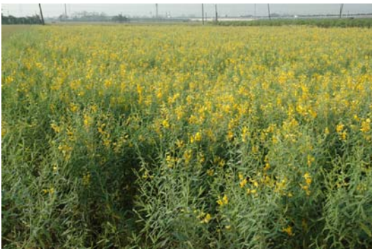
太陽麻開花結莢生長情形