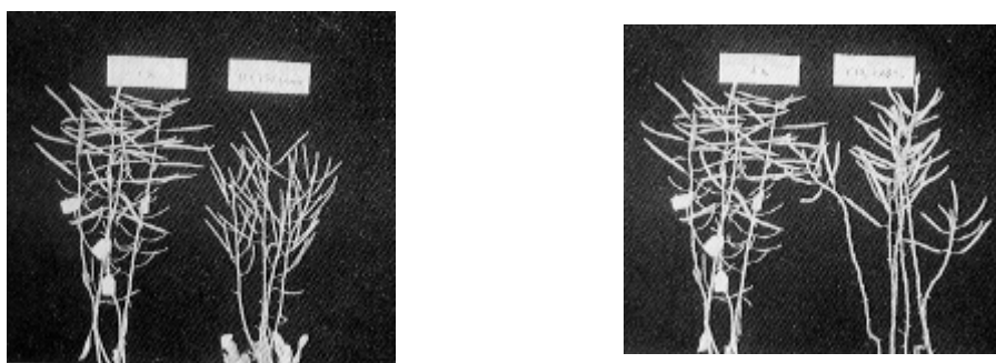
Fig 2a. Fig 2b.

Fig 1. Situation of cabbage ( K-Y cross ) flowers treat with CO 2 .