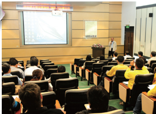
↑ 侯場長主持座談會

本場於98年11月3日在農業推廣大樓，辦理「洋桔梗農民座談、技術諮詢暨產業發展座談會」，會中邀請洋桔梗研究人員及外銷業者發表演說，與會人員包括各試驗研究機關、農會、種苗業者及農民約70餘人參加。