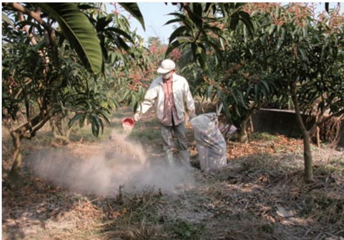
▲土壤酸度過高宜適度以石灰或蚵殼粉調整

7.5間。不少坡地果園為白堊土或青灰岩土，其含鈣量高，土質pH值偏高；相對在平地或平台與山谷地，卻易因長年使用酸性肥料或土壤有機質過少，易使土壤pH值變化過大，尤其是土壤酸化的問題。土壤酸鹼值過高及過低將造成土壤養分供應失調，導致土壤營養元素的有效性降低，並改變土壤微生物相，或引發土壤病變等問題，進而影響芒果根群的生長。