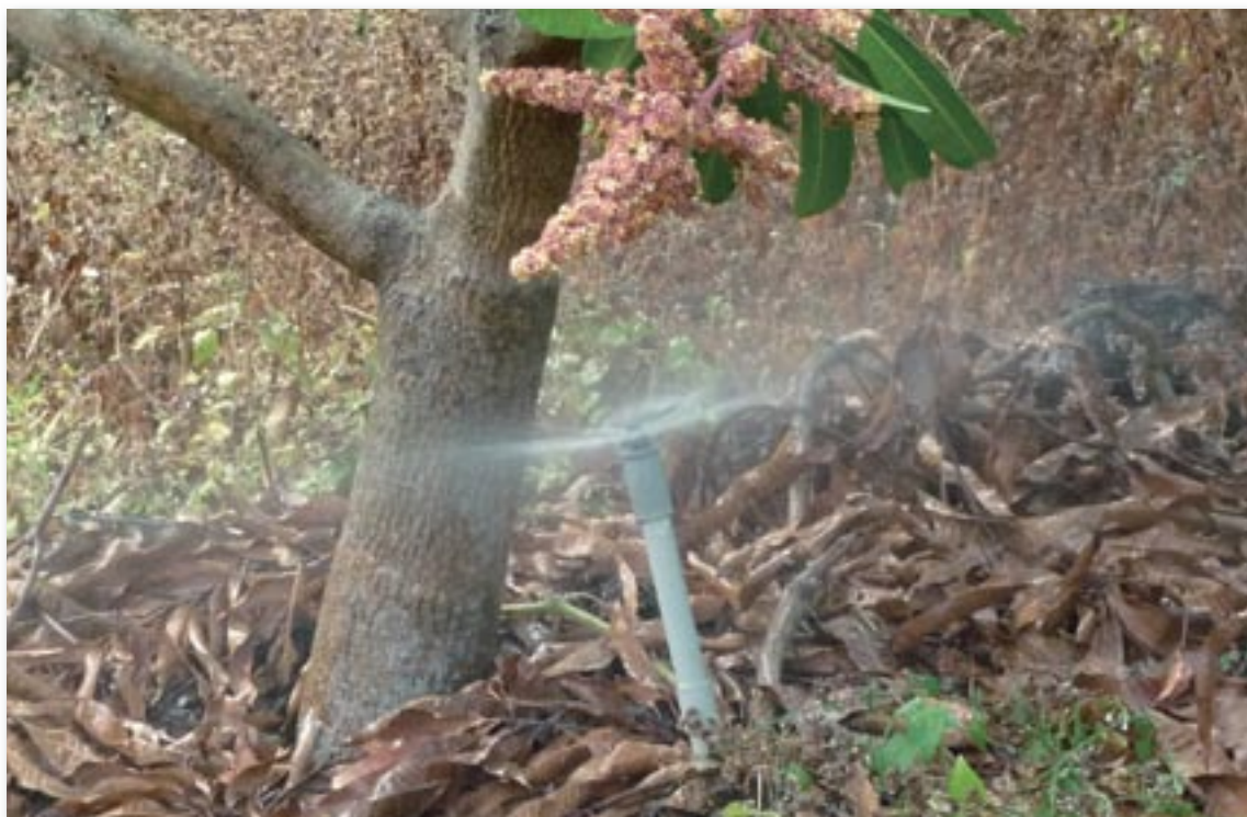
▲適度補水有助肥分的吸收