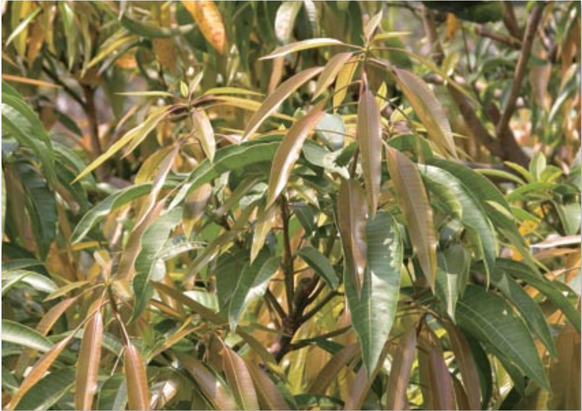
▲修剪以促進並培養優良的新梢，是穩產、優質芒果生產的開始