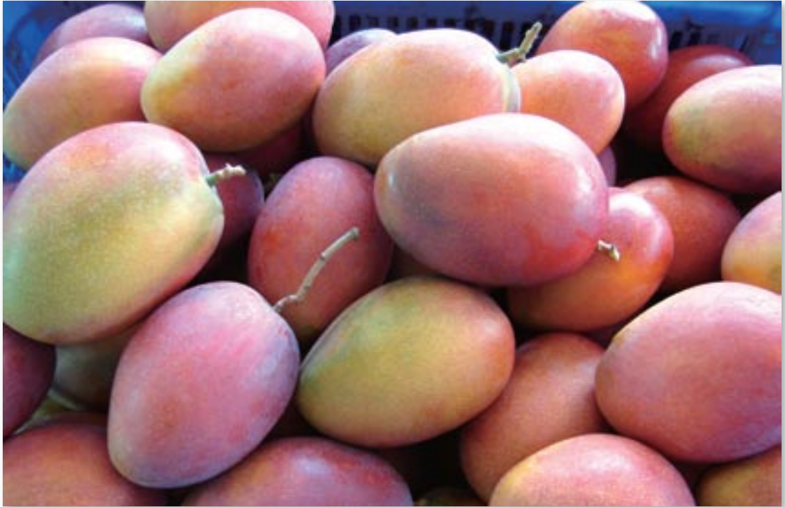
▲台灣水果的代表－優質的芒果

台南地區每年7~8月芒果果實採收完後，枝梢開始萌發發育，結果量少的植株則在5~6月即可能開始萌梢。11月中、下旬枝梢停止生長並進入花芽分化期。1月至3月進入花期，爾後約1個月確立進入結果期，至6月開始採收，如此循環。屏東地區因平均氣溫較高，其發育週期比台南地區提早約1.5個月。