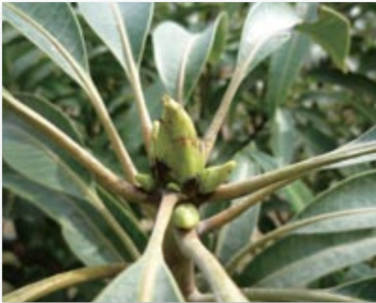
▲葉片採樣為開花枝第4或第5葉