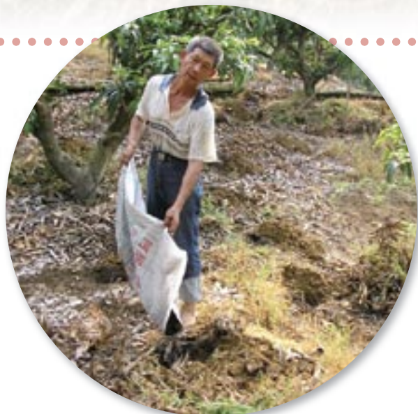
▲施肥應以掩埋入土為宜