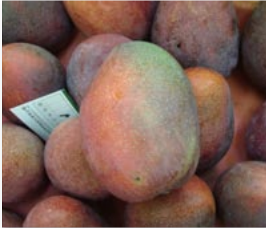
▲芒果末期氮肥過量易導致著色不均，俗稱「青頭」或「青尾」等現象

1000倍），一方面可抑制植株的營養生長，另一方面可促進著色，增加甜度、提高品質。