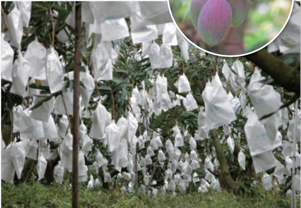
▲結實纍纍的優質芒果果園