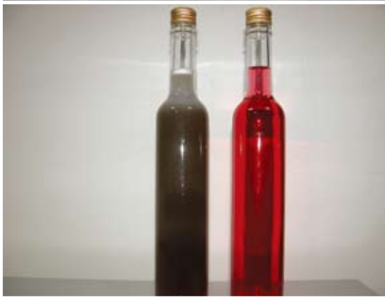
▲落花生天然花青素原料適合運用於各類食品加工添加物

候之因素，一年可種植二期作，主要栽培地區分佈在雲林縣、彰化縣，其中雲林地區佔台灣栽培面積和總生產量的三分之二以上。我國自91年(2002年)加入WTO後，依烏拉圭農業協定落花生由原來管制進口之產品改為關稅配額開放進口，採行關稅化措施，但進口落花生數量仍會影響國內落花生市場，再加上國內生產成本偏高，容易遭受鄰近國家低價成本競爭因素，導致產地價格波動，影響農民收益。因此如何加強與進口農產品區隔，選育出兼具豐產及加工用途多元性，提升國產落花生附加價值，增加市場競爭力，一直為本場落花生育種重點目標之一。