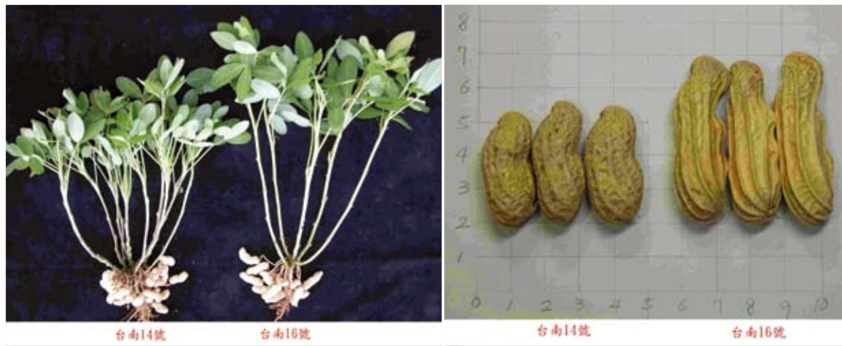
▲ 富含花青素之落花生新品種台南16號