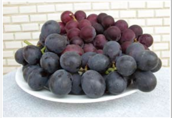
▲ 花青素常存在於深色水果中