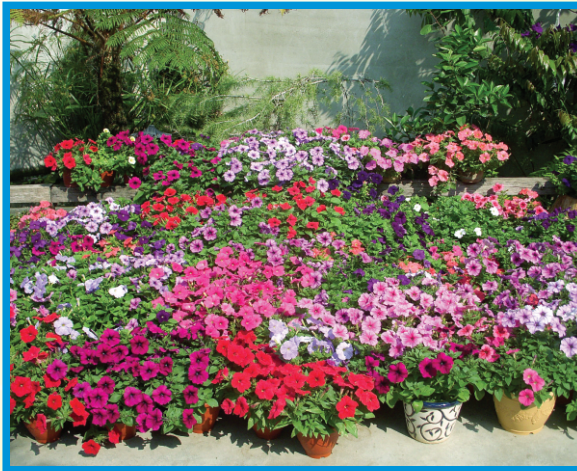
主辦單位提供的矮牽牛品種

這次活動在頒獎結束後，圓滿落幕，希望未來能繼續秉持活動的精神，美化四周環境，實現城市花園的夢想。