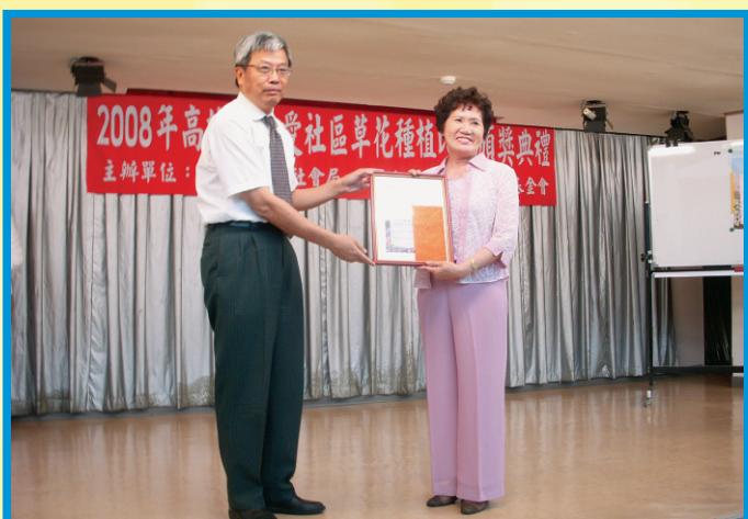
本場蔡副場長(左)蒞臨頒獎