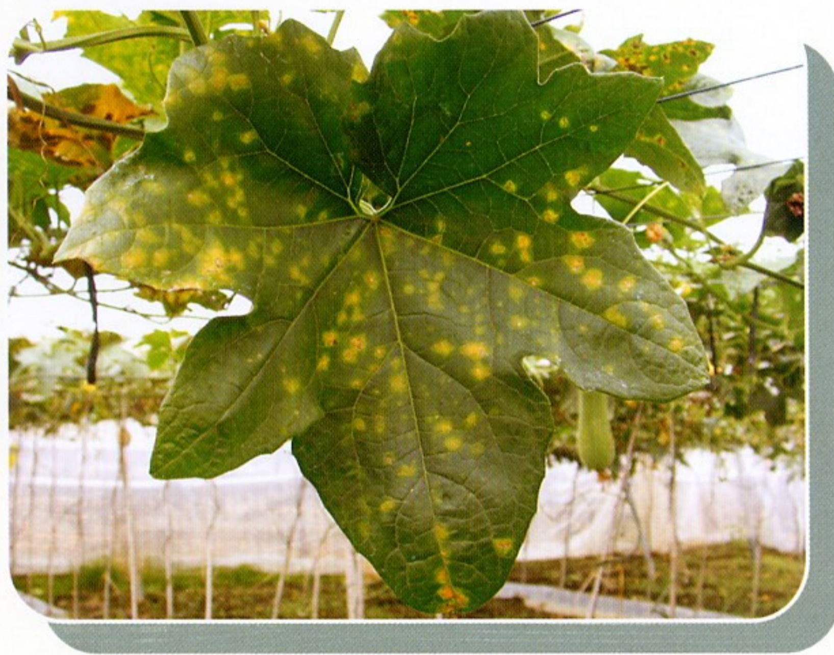
圖12. 露菌病病徵