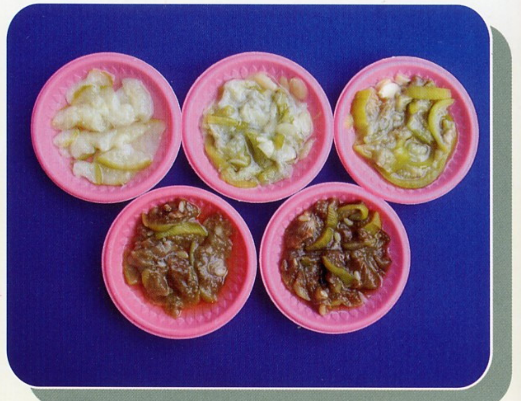
圖9. 普通絲瓜地方品種低溫期果肉煮後褐化 (粗鱗種、溪州種、高系15號及高系28號)