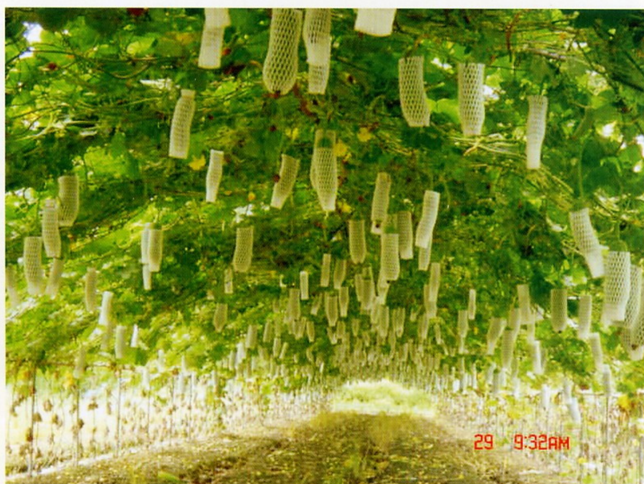
圖5. 絲瓜拱形棚架栽培。