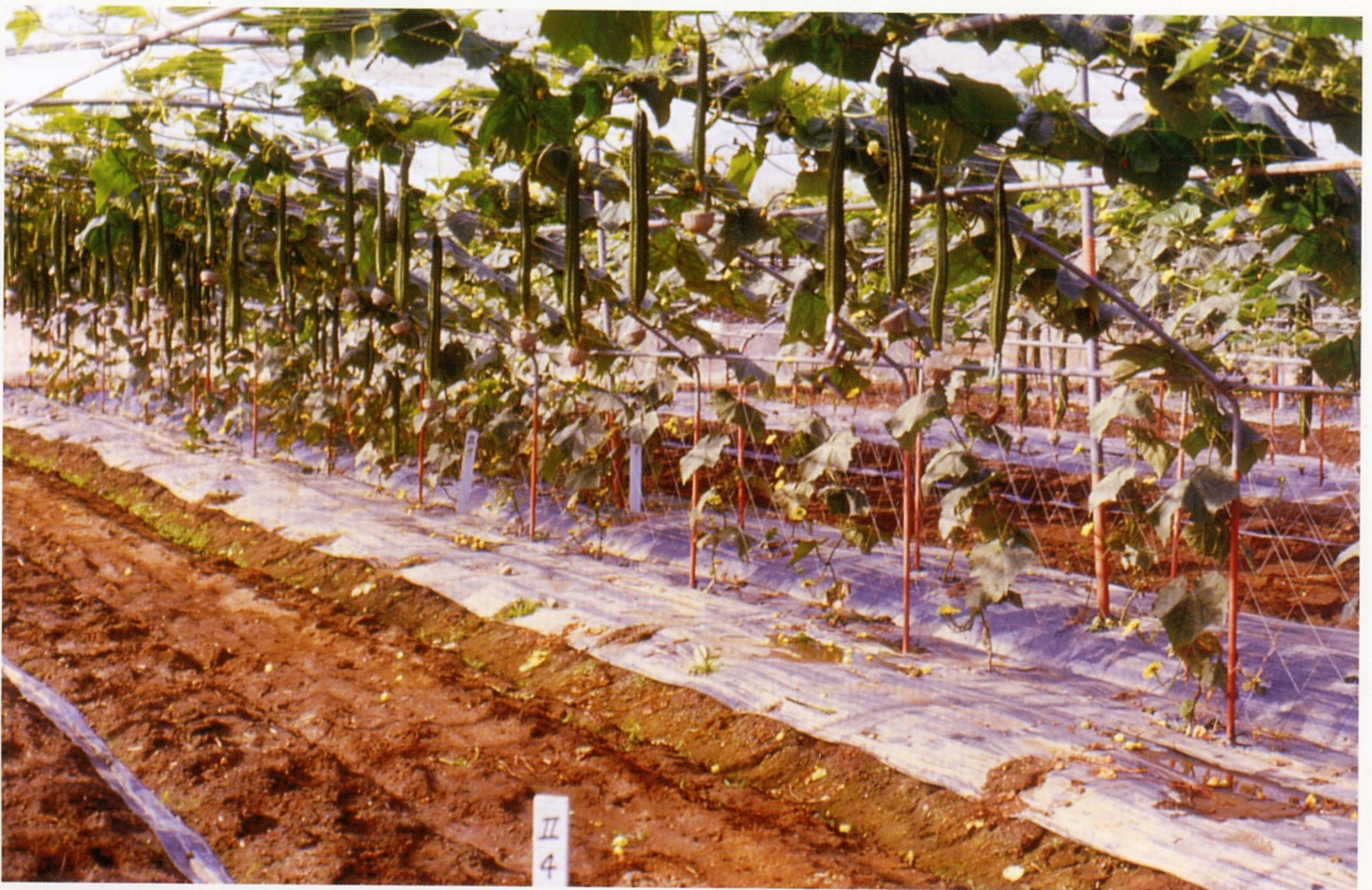
圖3. 稜角絲瓜之植株(品種：三喜)

原產印度，俗稱十角絲瓜、雨傘絲瓜或廣東絲瓜，植株及果實性狀與圓筒絲瓜有顯著不同(圖3)。一般種子黑色、瓜子形、較厚硬。種皮浮現花紋，子葉色淡綠，主脈不呈銀白色，本葉色淡綠，苗期葉脈間不呈銀白色。花瓣淺黃色，花葯淺黃，開花時間傍晚至翌日早上(下午4—6時開花)。子房細長無絨毛，果實表面有稜角10條，果肉較薄，纖維細密，肉質細脆密緻，無苦味。依頸部的形態可分細短、粗長及細長三個系統，適時採收嫩果肉質均細脆，纖維少而且食味、品質均比圓筒絲瓜較佳。但瓜果成熟老化曬乾後，不易除去果皮供作絲瓜筋用。稜角絲瓜耐濕性比圓筒絲瓜弱，大多品種對日照敏感，屬於短日性品種，有顯著的短日性結果習性，在長日照期間播種不易發生雌花。惟三喜、三喜二號、美菱品種，對日照長短反應不敏感，在長日照期間播種仍易結果，適於周年播種栽培。澎湖地區栽培特有地方品種，其果實較短，但食味特佳。