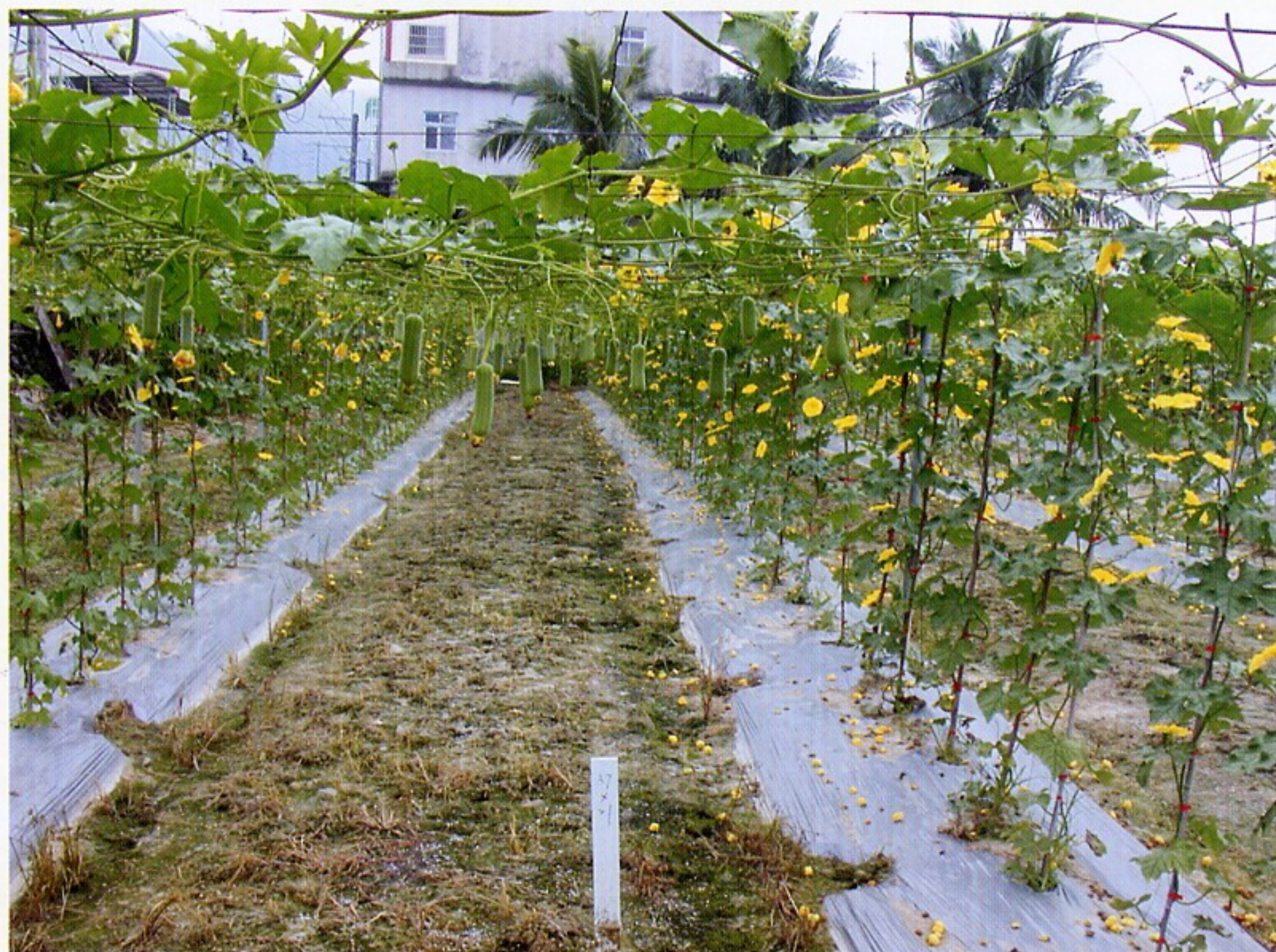
圖4. 絲瓜水平棚架栽培。

不論圓筒或稜角絲瓜，目前栽培以水平及拱形棚架居多(圖4-5)，跨距為4-5公尺。農民慣行種植株距為90-150公分，理蔓方式主要有三種，其一採藤蔓上棚架前除側蔓，上棚架後放任不理蔓；或者早期摘心留2子蔓，上棚架後放任不理蔓；水平棚架另有一法為上棚架前摘心留2子蔓，往相反兩分向引蔓，上棚架後放任不理蔓。本場則研發留單蔓生產技術，秋冬季採留母蔓單蔓，春夏季採留子蔓單蔓，配合優良品種高雄2號及高密度栽培，以生產安全優質絲瓜。採用留單蔓高密度栽培法之早期產量為傳統疏植方法之4-5倍，為搶早市最佳生產方法。