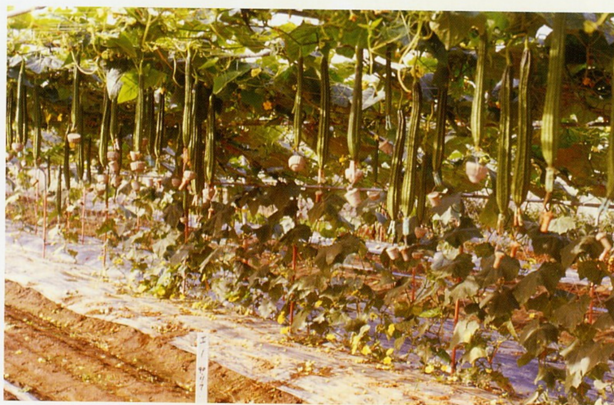
圖6. 秋冬季絲瓜採留母蔓單蔓高密度栽培法，可獲得較高產量 (上：圓筒絲瓜：品種：高雄2號；下：稜角絲瓜：品種：三喜)