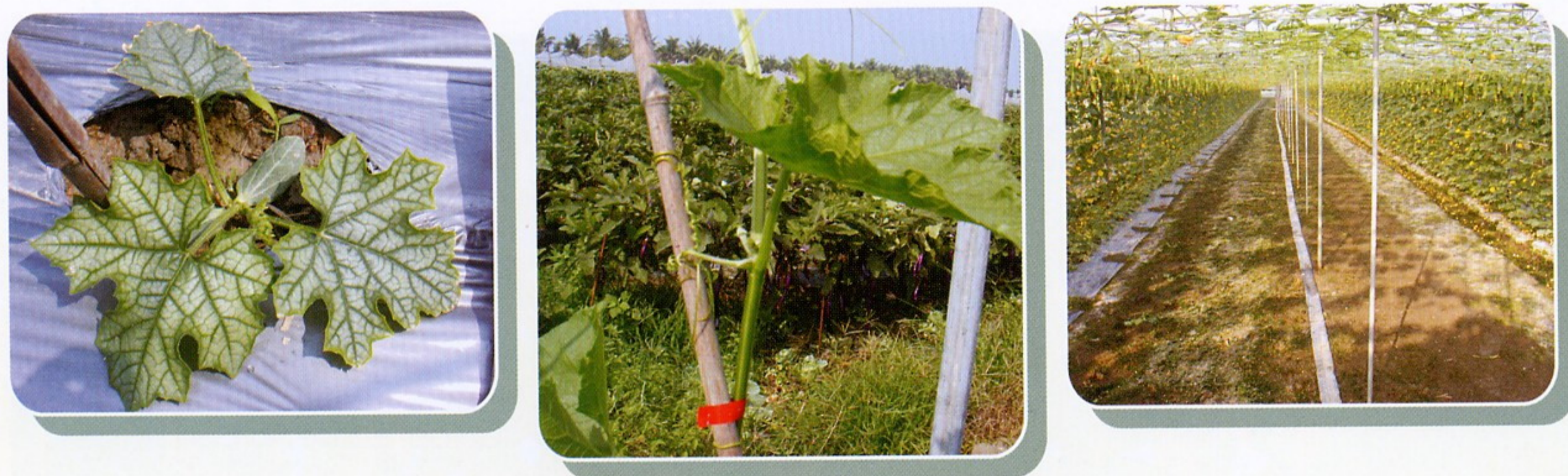
圖7.春夏季絲瓜留子蔓單蔓高密度栽培法行早期摘心，選留粗壯之子蔓1條(圖左)，優點為降低雌花始花節位(圖中)，增加節成性(圖右)。

春夏季絲瓜留子蔓單蔓高密度栽培法(圖7)適合株距亦為30—60公分，幼苗定植到田間成活後，葉齡4—5葉前早期摘心，選留粗壯之子蔓1條，其他理蔓去葉措施如留母蔓單蔓栽培法。春夏季絲瓜採留子蔓單蔓栽培其雌花始花期與慣行栽培法相近，優點為降低雌花始花節位5—7節，增加節成性，為高效率生產模式。