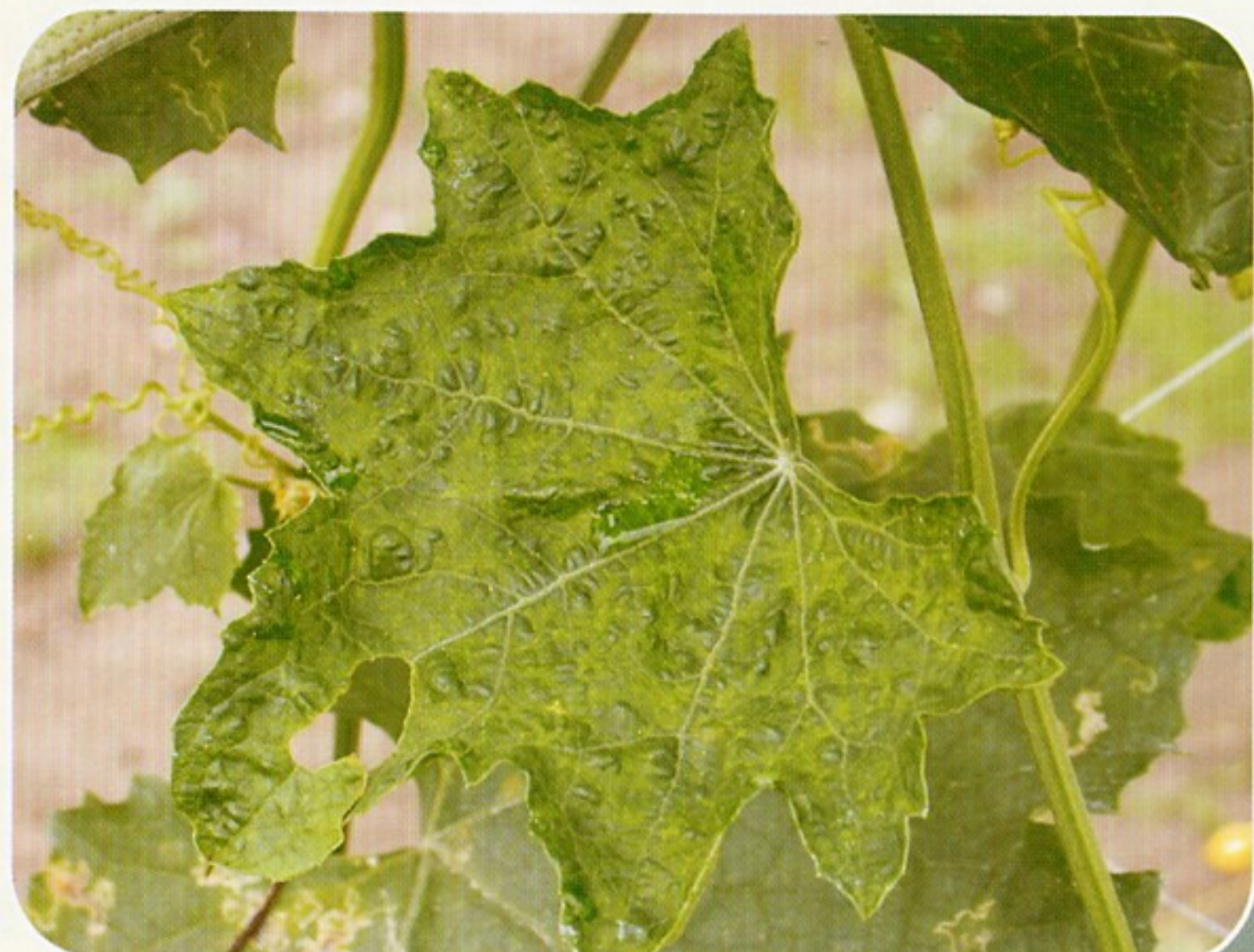
圖11. 病毒病病徵