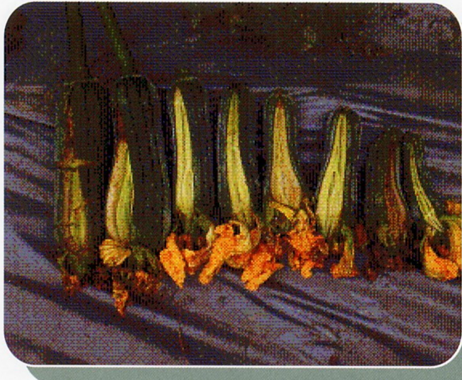
圖8. 粗鱗種裂果率高

裂果及低溫期果肉煮後褐化影響產量及品質至巨，是粗鱗種及溪州種等多數地方品種之缺點(圖8-9)。種植不易裂果及果肉煮後不會褐化之品種(如高雄2號)，為根本解決之道。種植粗鱗種及溪州種者，控制田間含水量勿過於濕潤或乾燥，可降低裂果率。