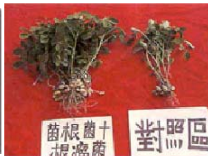
落花生施肥技術改進成果觀摩會