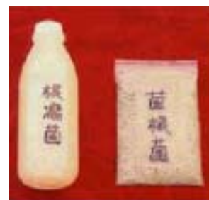
微生物肥料左為固氮根瘤菌，右為菌根菌