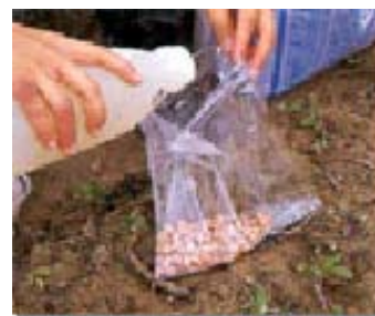
落花生微生物肥料之拌種情形