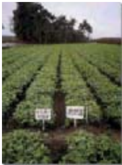
落花生植株生育比較。左：拌種菌根菌及根瘤菌。右：對照區

微生物肥料的功能，主要為(1) 固氮作用：固氮根瘤菌包括共生、協生及非共生固氮根瘤菌，可以將空氣中的氮素固定為氨，轉變成落花生可以利用的氮化合物，此作用是直接增加土壤的氮素來源，並能替代或減少化學氮肥的施用；(2)溶解作用：土壤中存有許多落花生不能利用的結合型營養元素，如磷、鈣、鐵等需靠根圈之溶解菌溶解後才能被利用，因此，溶解結合型營養元素的菌可以做為提供落花生營養再利用的功能，並可替代或減少化學肥料的施用，例如菌根菌；(3)增進根系營養吸收及生長的作用：微生物肥料中有增進根系營養吸收及生長的菌，增加根系吸收能力及表面積，即可減少化學肥料的施用，提高土壤中的營養供應效率，如菌根菌。