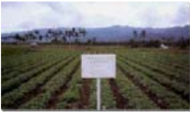
落花生施肥技術改進田間生育情形