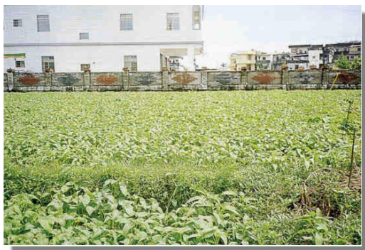
田間大面積生長之溫泉空心菜

本區宜蘭縣礁溪鄉因擁有清澈的溫泉聞名於世，素來係旅遊景點之一。礁溪鄉農會也依據溫泉水的特質，酸鹼值 PH 為 7.7，鹼度 338ppm，溫度保持在 26-28°C，水的成含有豐富的鐵、錳、鎂、鈣等微量元素，適合蔬菜生長，多年來由花蓮區農業改良場及礁溪鄉農會儘全力協助農友研發出以「溫泉」二字聞名於全台的蔬菜產品，計有溫泉空心菜、溫泉茭白筍及溫泉絲瓜等。近年來也再陸續推出溫泉番茄以及溫泉有機米二項產品問世。前述空心菜、茭白筍、絲瓜三種農產品，因品質佳，風味獨特，俱有地方特色，未來發展潛力可觀，已由省農林廳列入全省少量多樣化農特產品輔導產銷計畫項目之一。茲簡述溫泉農產品之特性如下：