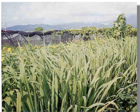
生育欣欣向榮之溫泉茭白筍

「溫泉茭白筍」：栽培品種以赤殼為主，於春節前後繁殖種苗，一個半月後苗高 2 台尺左右，取苗分株種植於水田，行株距為 90×90 公分一株，經過施肥，除草、田間管理病蟲防治，至中秋節前後一個月為盛產期。由於礁溪鄉生產之溫泉茭白筍，係引用溫泉水灌溉，生產期較金山鄉出產之白筍提早一個月，比埔里地區盛產期晚二個月，因此，彼此產期錯開，且生產量不多，售價每年均在利潤的合理價格範圍內，農民收益亦感滿意。採收後之嫩筍，經橫斷面切斷檢視茭白筍結果，因無黑色「黑穗病」菌核，顏色雪白，品質上乘，歷年來透過農會之冷藏貯存及共同運銷制度，送往台北果菜公司，成為中秋節前後最搶手之溫泉茭白筍。