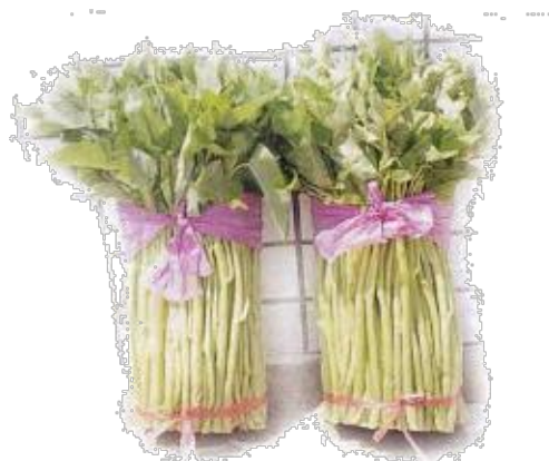
採收後每把三公斤待售之溫泉空心菜

「溫泉空心菜」採用品種以白骨大葉為主，栽培地區集中在該鄉德陽村（礁溪火車站對面），目前種植積已擴增至 30 公頃左右。農友利用 26-28°C 左右之溫泉水，於春天 1-2 月氣較冷時，經施用基肥後整平之水田，將種苗分株移植田間，栽培行株距為 20x25 公分，每穴植一株，每四行留一空行，以利日後之各項作業（施肥、除蟲、拔草、採收、搬運）。經 30-40 天左右，於 3 月下旬開始採收，經調理、分級包裝，每把束成一把三公斤，上市販售。採收後之空心菜園地，立刻施追肥，其莖基部迅速分蘖，再生後 20-25 天又可收穫一次，全年可採收 10-13 次。由於礁溪溫泉空心菜之莖較粗、葉片較大，熱炒後青脆爽口，且葉莖不易變黑，味道鮮美，已成一道有名之空心炒菜。