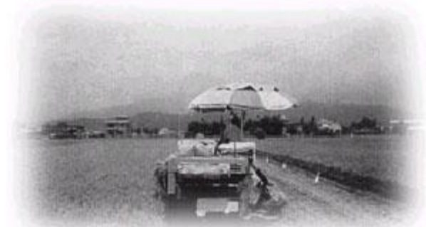
稻作代耕代營隊於收穫時併行斬草作業情形

稻草是農田有機質的重要來源，為達到農地永續使用之目的，在稻田收穫時可利用水稻聯合收穫機附掛切割機，併行斬草作