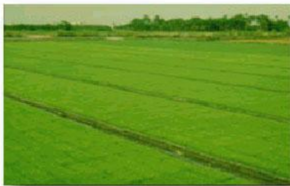
綠化場生育正常秧苗

稻苗徒長病之防除，必需同時配合田間的管理，如秧田發現罹病秧苗須隨時拔除，不可移植於本田。本田發現病株亦隨時拔除，減少傳染機會。原種繁殖田、採種繁殖田，宜選擇無病田區種植，避免感染病原。