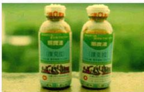
稻種消毒藥劑 25%撲克拉乳劑

頃，尤以玉里、富里二鄉鎮為主要生產區，面積約佔 77%，因其位於秀姑巒溪上游，水質清澈且無污染，氣候溫和、日照充足，稻穀豐產、品質優良。