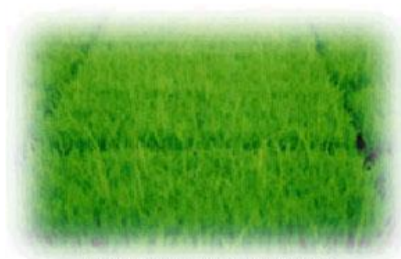
稻苗徒長病 (淡黃纖細者)

一、先將稻種先行以比重 1.10~1.13 之鹽水選種後，再予清水洗滌附著穀粒上之鹽份，並繼續浸水四小時。