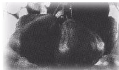
冬果蓮霧果型大，色澤濃郁，果農俗稱“黑珍珠”、“黑鑽石”

冬春果蓮霧生產技術目前雖已開發成功，但處理效果仍不穩定，主要原因為各果園平日之生長管理方法不同，植株發育情形各異，鳳山園藝試驗分所試驗所得之最佳方法，不一定適用於所有果園。生長勢極端旺盛之果園可能斷根程度必須更重，浸水日數須更長，生長抑制劑使用濃度須更高，使用次數須增加…等等，方可有效抑制營養生長。反之，生長勢衰弱之果園，亦可能因斷根、浸水、抑制劑處理不當等原因，導致植株生長受阻，無法開花結果，甚至衰弱枯死。因此果農須視各別果園植株生長發育情形斟酌修正產期調節處理方法，毫無經驗之果農可能須要嘗試處理 1~2 年始能漸有把握。另 7~8 月間氣候高溫多雨，植株營養生長極為旺盛，強行以人為之方法抑制其生長，促進 9 月上旬開「白露花」，12 月間開始採收冬果可能較感困難，成功之比率約僅 30~40%。10 月份以後，天氣漸轉冷涼，植株營養生長自然趨於緩慢，稍加人為之抑制處理，誘致植株於 12 月下旬開「冬至花」則極為容易，成功之比率約 80~90%。惟「冬至花」果實採收期將延後至 3 月開始，價格與 12 月、1 月生產之果實有極大差距。如何提高「白露花」成功之比率為今後果農努力的重要目標。