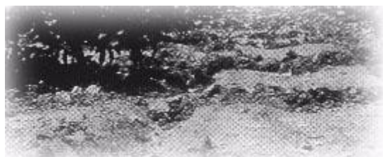
果園斷根處理之二：條狀斷根

依據鳳山熱帶園藝試驗分所近幾年來之試驗結果顯示，耕作處理對促進蓮霧花芽分化之效果較藥劑處理為佳，其中又以斷根、浸水兩者併用之效果最佳，單獨浸水處理其次，斷根處理再其次。藥劑處理則以 Ethrel 和 C.C.C 兩種最有效，其中 Ethrel 之效果又優於 C.C.C。綜合試驗結果，以斷根、浸