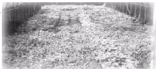
連作發生障礙造成萌芽不整齊

每逢夏季(5~9月)蔬菜受颱風、豪雨以及高溫、病蟲害猖獗之影響，蔬菜生產常感不足，市場供應不穩定，因此如何有效改進生產方式，以避免災害造成損失，並提高蔬菜品質和產量，為當務之急。目前荷蘭及日本等國精密之設施，作物在完全人為控制之條件下生長，可以達到高產量、高品質與產期調節之效果。惟蔬菜的售價不高，而精密設施之成本昂貴，不符合經濟效益，因此仍以簡易設施為佳。本省最常見的簡易設施構造以鍍鋅鐵管作骨架，四周以16目的防蟲網或塑膠布包圍，頂部以聚乙烯塑膠布覆蓋、夏季炎熱時，四周僅以防蟲網來隔離昆蟲，有助於設施內空氣對流，降低溫度。冬季為阻隔室外的低溫，則在防蟲網外側再加一層塑膠布，達到保溫之效果。目前農民在上述簡易設施內，栽植蔬菜常發生蔬菜生育衰弱或徒長；連續栽培同一種蔬菜，一段時間後，產量降低或病蟲害無法控制等問題。茲針對設施內高溫、高濕及連作障礙等三項問題提出改進建議如下，以供農民參考。