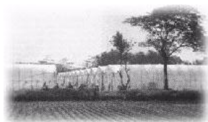
大面積簡易設施栽培蔬菜

大多數之設施如網室、塑膠布室、防雨棚都會遭遇到高溫之問題。而造成蔬菜發育不良，生育衰弱徒長。在生殖生長上可能引起花器分化發育不完全，造成開花、授粉、受精、著果不良，導致產量降低或品質不良。白天設施中的熱源主為太陽輻射熱，加上空氣對流不佳，高溫易蓄積，空內外溫差可高達10~15℃。夜間設施內主要熱源為地熱放射及空