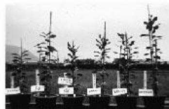
文旦柚砧木施用微生物肥料後，生長勢較不施用者好。CK + Bran 為不施用微生物肥料之處理其餘為施用不同配方微生物肥料之處理

目前本場有關微生物肥料的試驗作物有苦柚（文旦柚砧木）、玫瑰、百合、西瓜四種園藝作物，文旦柚砧木的菌種接種試驗自 82 年 11 月開始，至 83 年 12 月，已可明顯看出試驗處理中，以三種菌混合的配方之微生物肥料（內生菌根菌、溶磷細菌及游離性固氮菌，VA+PD+NF）對文旦柚砧木的生長最為有效，生長勢明顯的比對照組（CK + Bran)好(如圖二)。對於百合、玫瑰及西瓜之研究正在進行中。