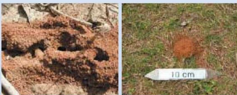
▲其他螞蟻成熟蟻巢

由於紅火蟻有保護巢穴的特性，一旦蟻巢受到碰觸，便會傾巢而出攻擊敵人，在野外發現蟻巢時，不宜干擾蟻穴。屋外有草皮者須注意防範紅火蟻入侵，在庭院或其他戶外區域可以使用含有合成除蟲菊或其他有效成分的噴霧劑