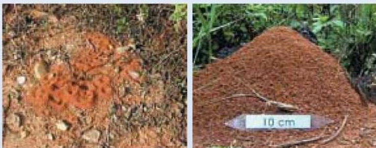
▲入侵紅火蟻蟻丘，初期蟻巢(左)，成熟蟻巢有明顯隆起的蟻丘(右)

入侵紅火蟻為完全地棲型蟻巢的螞蟻種類，成熟蟻巢會以土壤堆出高約10~30公分直徑約30~50公分的蟻丘，但新形成蟻巢約在4~9個月後才會成熟而出現明顯小土丘狀的蟻丘，是快速確認入侵紅火蟻的方法之一；目前台灣約270種螞蟻中，皆不會築出高於地面10公分以上的蟻丘，因此可為判定的依據。但未成熟前的蟻丘並不明顯，不易與其他種螞蟻的蟻巢區別，民眾需提高警覺。