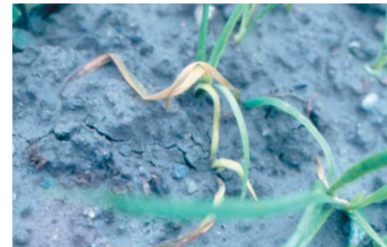
▲菌核病易造成植株地基部與葉片黃化萎凋