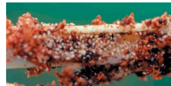
▲根蟻危害地下部時，常可見成群蟲體

根蟻發生時開始灌注43% 佈飛松乳劑，每公頃施用1公升，稀釋1,000倍，於採收前12天停止施藥。