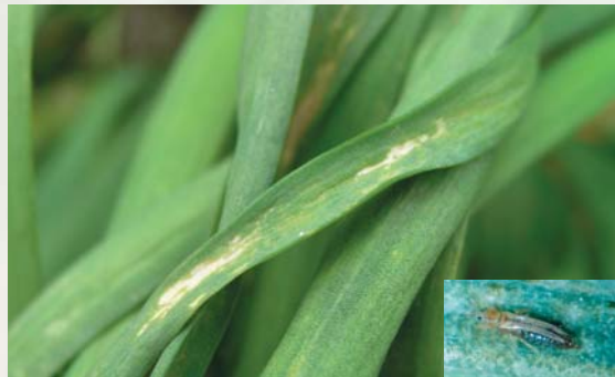
▲薊馬危害葉部造成白色長形斑(右下為薊馬成蟲)