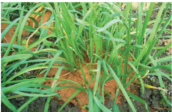
▲韭菜栽培時於畦上填入木屑，可使韭白較長

台灣氣候適合韭菜的生長，可周年栽培，根據農委會93年度農作物統計資料顯示，全台韭菜栽培面積為995公頃，生產量為39,718公噸，產值為7億9千萬元，目前栽培面積以彰化縣為最大宗，其次為花蓮縣。花蓮縣栽培韭菜的面積為80公頃，其中吉安鄉為縣內的主要產區，本地區栽培方式特殊，農民築畦後，以鋤頭將畦緊壓成一條條凹陷溝，再將韭菜種植於溝內，待韭菜長到一定高度後，再回填木屑，以此栽培方式生產的韭菜莖基部非白甚長，品質與其他縣市不同，為本地區韭菜的最大特色。為協助農友生產高品質的韭菜，本場彙整韭菜主要病蟲害的發生徵狀與防治方法，以供農友參考。