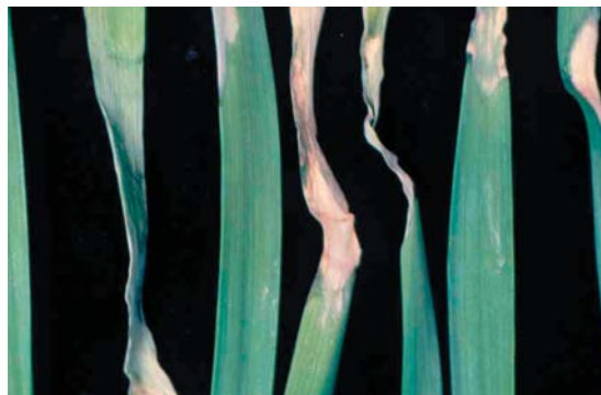
▲韭菜發生疫病後，造成葉片反折且黃化