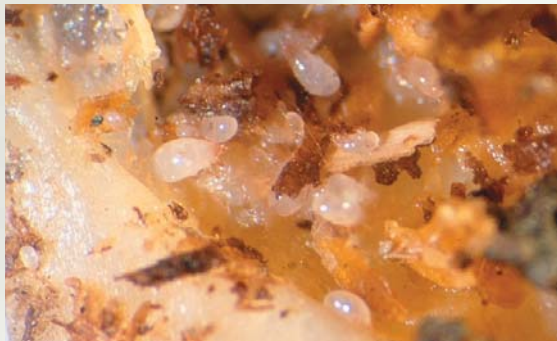
▲根蝨聚集取食，造成植株地下部腐爛