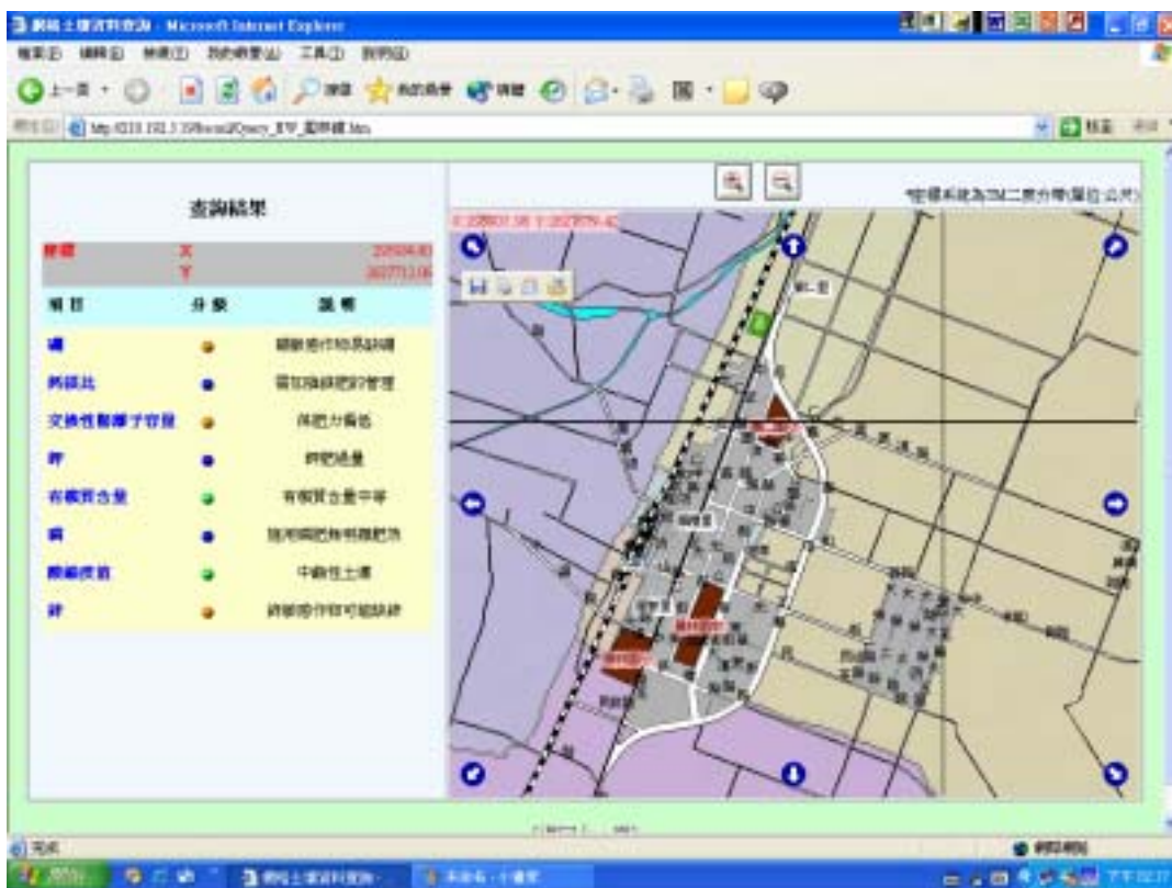
圖四、單點網格土壤資料查詢及肥培管理建議顯示。