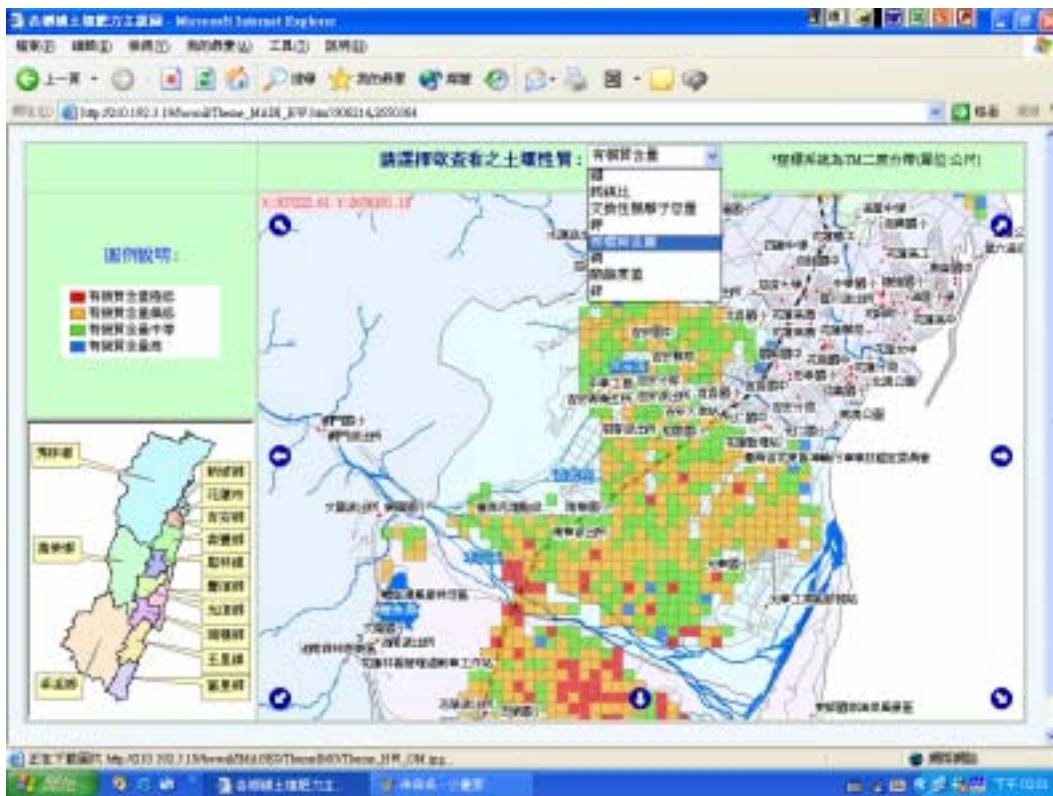
圖三、土壤肥力管理主題圖。