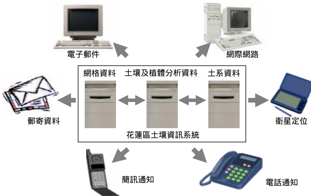
圖六、花蓮區土壤資訊系統架構圖。