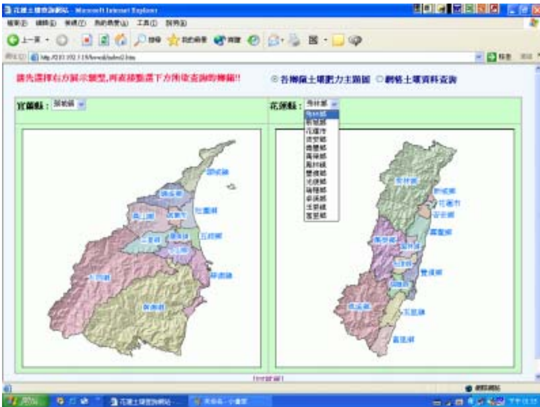
圖二、利用下拉式選單進行資料點選。