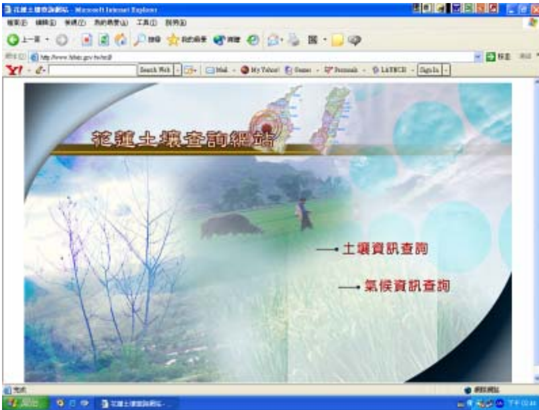
圖一、花蓮區土壤肥力資訊網首頁。