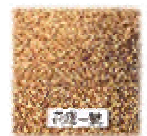
花蓮二號 子粒外觀

大豆花蓮二號係由高雄區農業改良場於民國 66 年夏作以「大連豆」與「和歌島」雜交將其雜交後裔提供本場進行各世代選育。至民國 70 年選出花育 70 40 品系參加各級產量比較試驗並於 73 74 年春、夏、秋作參加全省區域試驗，結果產量高且穩定，尤其適合花蓮地區夏作栽培，而於 77 年夏作提出命名，經審查通過登記命名為「花蓮二號」。