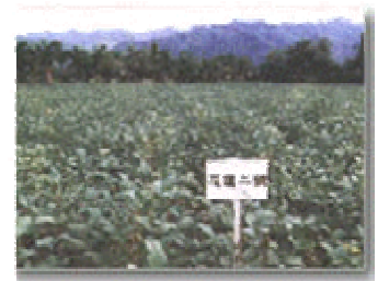
花蓮二號葉片及葉片 角度小透光率大