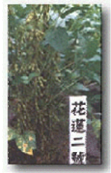
花蓮二號 單株結莢情形

大豆原產於我國大陸東北，栽培歷史悠久，目前大陸栽培面積及年產量僅次於美國、巴西，居世界第三位。台灣早於四百年前即有大豆栽培，唯因當時品種未經改良，生育不良、產量低，大多僅供綠肥之用，自抗戰勝利台灣光復後，各試驗改良場所由國外引進新品種及不斷的研究改良，品質及產量逐漸提高，民國 48 56 年間台灣大豆栽培面積曾多達 5 6 萬公頃，惟 56 年以後因大豆開放進口，價格低加上競爭作物增加之影響，栽培面積逐漸減少，至 77 年 6 月止栽培面積僅約 9 千頃左右，因此幾乎 90 % 以上仰賴國外進口，政府為提高大豆自給率，對於台灣大豆選育推廣工作極盡鼓勵與輔導，並早於民國 62 年，即訂定保證價格收購辦法，輔導農民增產。前台灣大豆主要栽培地區分布在高屏地區、嘉南平原及花東兩縣，而東部地區因受氣候、地理環境之影響，除日照較西部短且弱外，土壤地力亦差，因此，一般推廣之品種在東部地區栽培未能表現其應有之潛力，本場有鑑於此，自民國 56 年即針對東部地區特殊環境致力於大豆品種改良工作，並於民國 68 年育成「大豆花蓮一號」正式推廣，近年來花蓮地區栽培面積均維持一千公頃左右，其中花蓮一號佔 80%，年平均公頃產量亦由民國 68 年以前之 1,200 公斤提高至 1,500 公斤左右，唯仍嫌偏低，探討結果發現花蓮一號葉片大，透光率不良，若種植稍密或氮肥施用不當，則易引起徒長進而倒伏以致影響產量，同時最低結莢高度較低(10.5 11.2 公分)，不適機械採收，針對這些缺點及問題本場在選育工作上不斷加以改良而不斷加以改良而今育成又一大豆新品種 - 「花蓮二號」。