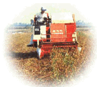
大豆聯合收穫機 田間採收情形