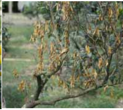
罹病嚴重植株，地上部葉片變黃或落葉