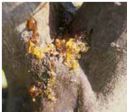
金柑植株受疫病菌感染後於莖基部呈現流膠現象