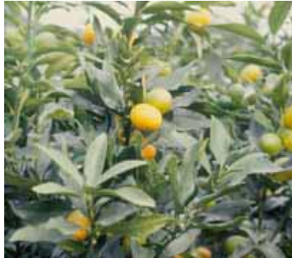
金黃色的金柑是宜蘭地區的重要農特產品