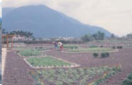
將不同的香草植物種植在區塊內