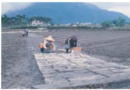
鋪置石板時底部可利用河砂整平