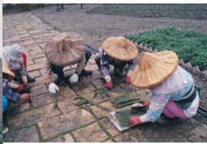
石板與石板之間空隙將草皮植入

二、先將整個園區整平，測量出主要步道的長度與寬度後壓實，步道兩側要做好水平，將來才會有利於灌排水。園區內營造出一條步道，使用花崗石板是不錯的選擇，在鋪設時石板與石板之間必須留些間隔(大約 5 公分左右)，感覺上會比較自然美觀與生動。施工方法很簡單，只要在整平的表土上撒上一層薄薄河砂，將花崗石板放置妥當，站上去踩踏看看是否平整即可。