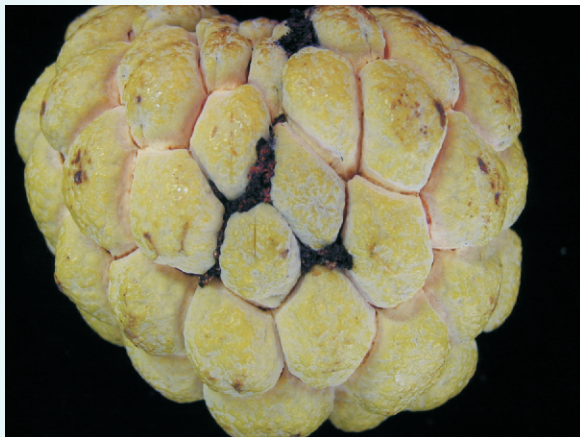
圖8. 斑螟蛾危害果實

至果皮外(圖9)，再以口吐絲粘成長形囊狀，粘貼在果皮外。幼蟲有相互殘殺性，因此一條隧道只容納1隻幼蟲，若一粒果實有2隻幼蟲時，則彼此相互吐絲隔開。至5月下旬時，第二代成蟲羽化出現，並繼續在第一期果產卵危害，至7月時第三代成蟲大量出現，造成第三代幼蟲密度達高峰期，故此時第一期果被害最嚴重。另外於11月上旬時第五代幼蟲密度高峰期而第二期果相對地被害也最嚴重。老熟幼蟲於化蛹前，可蛀食至另一端之果皮下，吐絲作繭準備化蛹；幼蟲期約38-45天，蛹期7-10天。被害果實初呈局部黑化、枯乾，輕者果實畸形，重者受害部位漸擴大至整果實呈黑變木乃伊化而仍留於果樹上。若不防治，80%以上果實被害，尤其以坡地果園被害較嚴重，實為番荔枝最重要的害蟲。