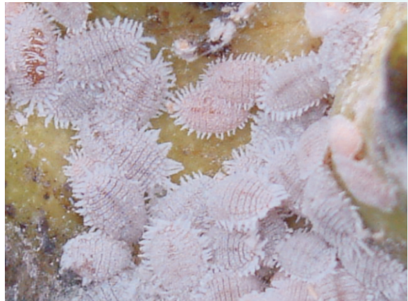
圖13. 太平洋臀紋粉介殼蟲群聚危害

到中果期(果徑約4-5公分)時，又移行到果實鱗溝間隙中大量繁殖，蟲口密度達到高峰，當7-9月間進行第二期果修剪，且8-10月間又逢第一期採收期時，密度則下降，到11-12月下旬間，因雨水減少、氣候乾燥且第二期果進入中果期，食料及棲息場所增多，蟲源又多，密度又達到高峰，危害甚至較第一期果嚴重。隔年1-2月間行強剪及採收第二期果時，又將該蟲棲息場所清除，密度又趨下降，而殘存的蟲體又移行至裂縫等隱蔽處越冬。