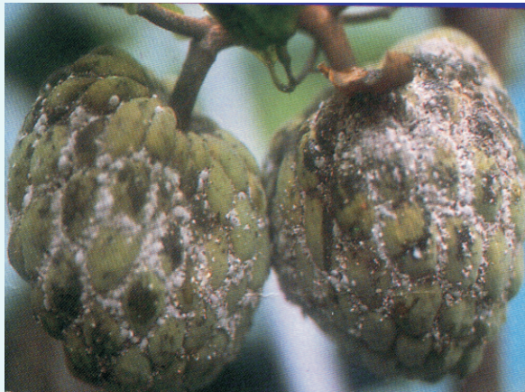
圖12. 太平洋臀紋粉介殼蟲危害果實

蟲經涂等(1988)報告列為臺灣新紀錄種。太平洋臀紋粉介殼蟲在番荔枝果園發生面積最廣且密度最高，危害較嚴重。成、若蟲群聚於葉片背面及果上刺吸汁液(圖12)，不但使生長勢衰退，並排泄蜜露引誘螞蟻、蠅類等前來取食(圖13)，誘發煤病，密度高時更有一股腥味，影響果實品質甚鉅。該蟲會在番荔枝樹皮裂縫、主幹隱蔽處、被修剪後棄置在果樹下的枝條上，或移行到地際部主根等處越冬，隔年春天時，若蟲沿主幹遷移到營養枝條上，當第一期果長