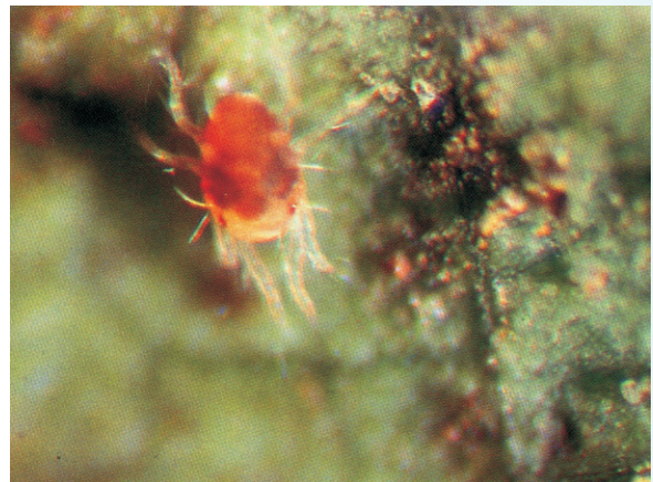
圖11. 神澤式葉蟎成蟲

移行至葉面上，如果遇到下雨，密度驟減，待梅雨期過後，5月下旬-6月間氣溫適中且乾燥，第一期果危害達到高峰，8-9月間雨水多，密度下降，但至11月到隔年1月間，氣候乾燥，第二期果的中、老葉被害又趨嚴重而達高峰，2-3月立春間果農進行行強剪，被害枝條、葉片均被剪下，棄置在果樹下，雖然密度下降，但葉蟎類卻從剪下的枝葉上移行至主幹裂縫或草上越冬，存活到隔年春天，成為第一次感染源，繼續繁殖蔓延危害。