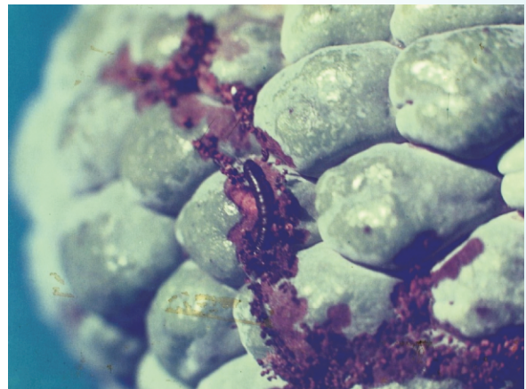
圖9. 斑螟蛾幼蟲及危害狀