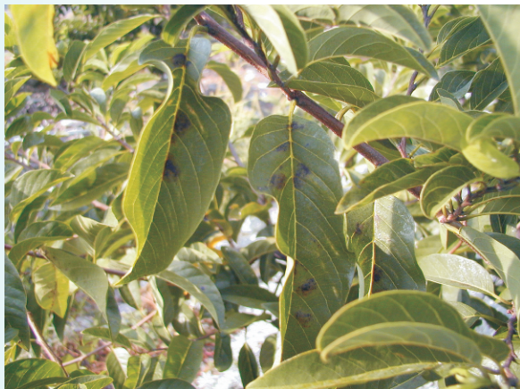
圖10. 神澤式葉蟎危害葉部

cucurbitae )、椽果葉蟎 ( Oligonychus mangiferus )及 Tetranychus neoculendonicus 等五種。成、若、幼蟎等會群聚在番荔枝果樹的中、老葉上，沿葉脈取食危害，被害部位開始呈現銹色斑點(圖10)，繼而葉片枯黃掉落，光合作用減少，影響樹勢的生長，發生嚴重時，即使能結果，果實也發育不良，品質降低。每年春天新梢長到約12-15公分時，葉蟎類從越冬場所如樹皮裂縫或鄰近其他果樹(圖11)，移行到番荔枝葉片上取食，開始時在葉背，但密度高時可