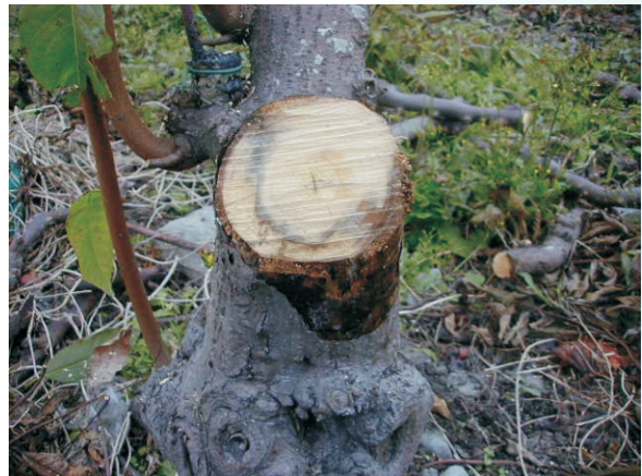
圖2. 被害莖部可見黑褐色壞死組織區，被感染組織和健康組織界限清楚

色，而後轉為褐色或深褐色，厚度約2-3公分。本菌可生長的溫度為10-12°C到35-37°C，最適溫24-32°C。菌絲生長喜好酸性，在酸鹼值pH7.0以上的培養基中不容易生長，在土壤中至少可存活半年以上，在罹病根莖組織中則可存活達10年之久，因此，被感染的樹根或樹幹是本病菌長期存活的主要處所。病菌除可藉健株和病株的根系交纏或藉病土直接傳播外，也可藉擔孢子或斷裂分生子作長距離的傳播。