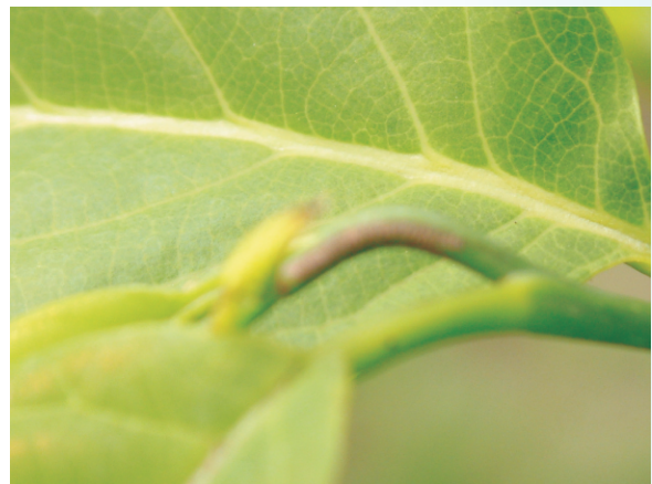
圖7. 薊馬剝吸危害心葉幼莖