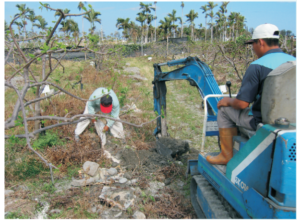
圖14. 施用苦土石灰，要與土壤充分混合