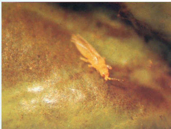
圖6. 薊馬危害心葉部

部10節，9-10節之刺毛甚長；足黃色，腿節外緣褐色；雄成蟲黃色，體長約1.05公釐。當番荔枝於翌春長出嫩心芽時(約3-5月)，薊馬成蟲從鄰近檬果園或園中雜草嫩心芽或花器上飛到番荔枝上，侵入未展開的嫩心葉銼吸取食並產卵，被害嫩心葉捲曲、畸形且局部黑褐化(圖7)。5-6月間花期時，移到花器危害；6-7月間結小果期時，又移至幼果果蒂及果柄上危害，造成銼傷果疤。而第二期果嫩心葉期、花期(10-11月)及結小果期(11-12月)也同樣遭受其危害。薊馬類每年於5-7月及10-11月發生密度最高，尤其在無噴水灌溉的果園及乾燥氣候下，更是大量發生危害。田間雜草如假馬唐、野薊苳等都是姬黃薊馬的中間寄主植物。