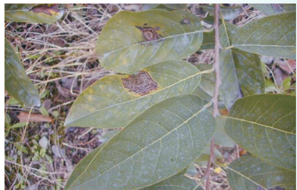
圖5. 罹患炭疽病之葉片