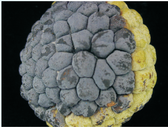
圖3. 番荔枝疫病果發病情形

擴大(圖3)，高濕時患部會泌出黑褐色膠質，剖開果實通常可見果肉病部前緣組織為淡褐色水浸狀(圖4)，後來變為黑褐色，有些樣品的病部前緣為暗褐色，不容易與黑腐病區別，環境適宜時病勢進展迅速，5-7天後即整果變黑，