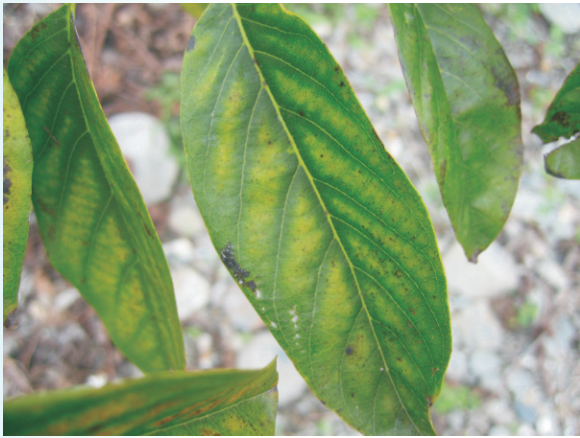
圖13. 番荔枝葉片缺鎂