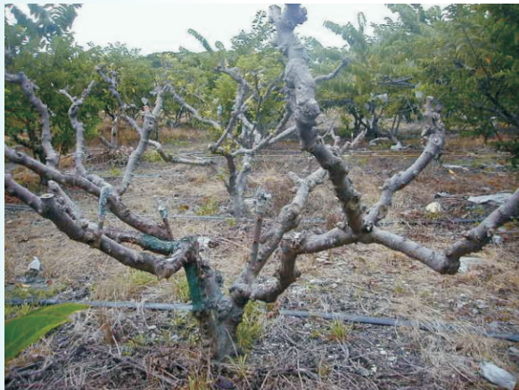
圖1. 田間植株遭受危害後新葉不長

朽病的病株區別，但檢視罹病根及地際部主幹，可看見其表皮上黏附褐色絨毛狀菌絲層、土塊和小石粒，褐色菌絲有時往外延伸，被覆在鄰近土塊、石粒，相當容易辨識。解剖被害根、莖部，可看見黑褐色的壞死組織區，被感染組織和健康組界線清楚(圖2)，將病患部放在高濕環境下，會長出白色後轉成褐色的絨毛狀菌絲。病勢繼續發展則導致被感染組織腐朽，整株植株枯死。在潮濕的環境下，罹病樹幹的基部偶爾長出不規則的扁平覆瓦狀子實體，初期黃褐