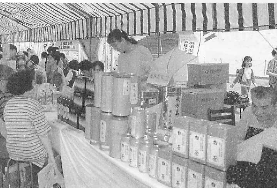
▲各縣特產茶展售情形