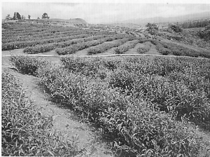
▲越南茶園栽種台茶品種情形

泰、山羅、宣光、老街、河江、南越林同省及越南中部等二十餘省，估計全國適合種茶面積為三十萬公頃，越南政府預計每年鼓勵增加五千公頃茶園，計劃擴充至二十一萬五千公頃並計劃改善老舊廠房提高其產能至每天可處理1萬2千至4萬