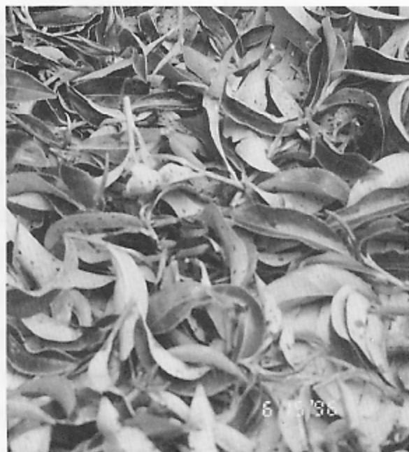
▲在越南栽種之青心烏龍品種，由於易遭受病蟲害，栽種不易成功

越南政府對茶葉發展及試驗研究非常重視，在越南北部永富省設有一茶葉試驗所（距河內北方約120公里），其前身為法國統治越南時於1918年設立之茶葉試驗場，目前該試