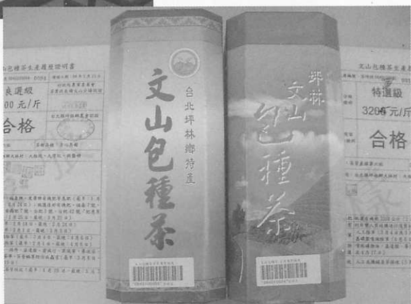
生產履歷生產之文山包種茶