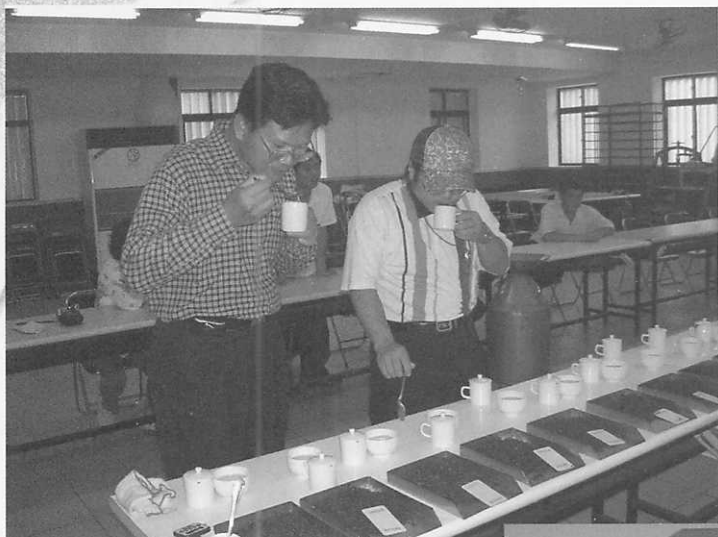
文山包種茶分級評鑑