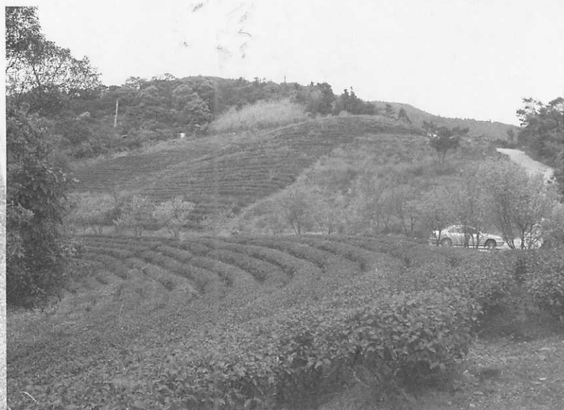
優質文山包種茶茶園