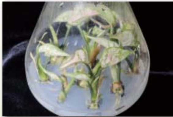
圖2. 紅粗肋草分蘖幼株的發育