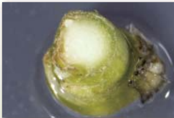
圖1. 紅粗肋草培植體開始增殖芽體

組織培養時得先處理內生菌嚴重污染，培植體難以充分殺菌的問題。有學者曾以高濃度的抗生素及缺水處理，企圖降低培植體的污染率，惟處理後易呈現毒