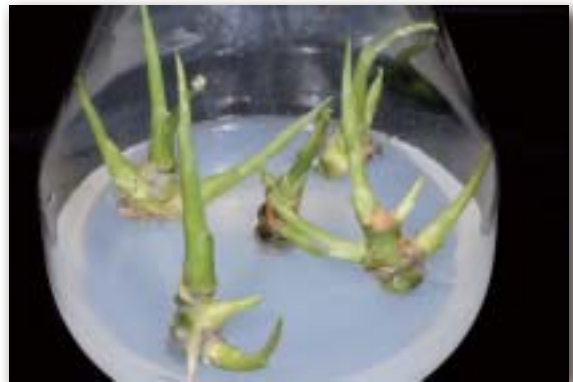
圖4. 紅粗肋草之組織培養植株再生

目前，本組織培養繁殖系統應用於其他彩葉或綠色的粗肋草品種，效果亦佳；另嘗試修改培養方式，亦能誘導培植體產生更多的芽體（圖5），提升繁殖效率。相信不久的將來，必能克服難以微體繁殖方式生產種苗的困境，達到量產的目的。🌱