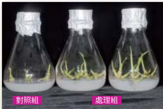
圖3. 處理組（右）較對照組（左）之株高增加量呈顯著性差異

分蘖幼株的生長極為緩慢，經修改培養基組成份，調整適當的植物生長調節劑濃度，可以改變生長狀況，進而促進分蘖幼株的抽長與株高。在數週的促進生長培養中，處理組可增加3公分以上的株高，與