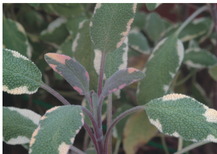
三色鼠尾草 ( Salvia officinalis 'Tricolor') 應用: 抗菌助消化、婦女調經止痛藥、西餐料理常用的香料、製作沐浴用品。