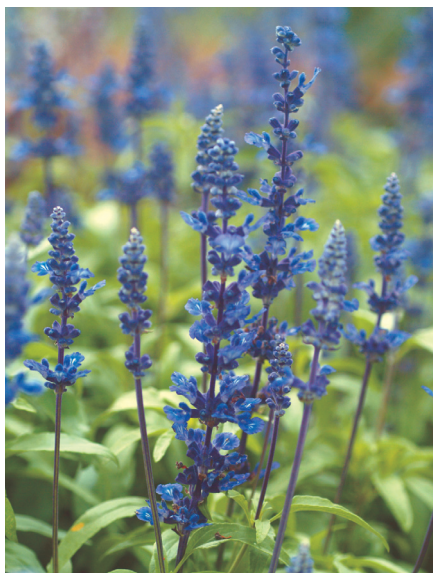
粉萼鼠尾草 (觀賞用)