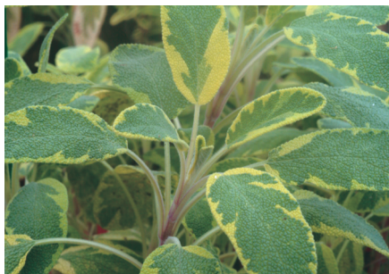
金色鼠尾草 ( Salvia officinalis 'Icterina'), 多年生小灌木, 全日照植物, 原產地中海沿岸, 花期在春季, 葉片有黃綠色斑紋, 氣味較淡, 孕婦忌大量食用。 應用: 抗菌助消化、婦女調經止痛藥、西餐料理常用的香料、製作沐浴用品。