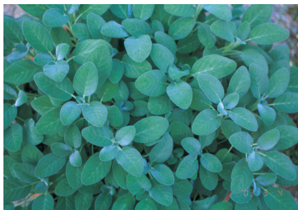
寬葉鼠尾草 (巴格旦) ( Salvia officinalis 'Berggarten'), 多年生, 株高約45公分, 葉片較大、綠色, 花穗紫色細毛。 應用: 庭園觀賞用。