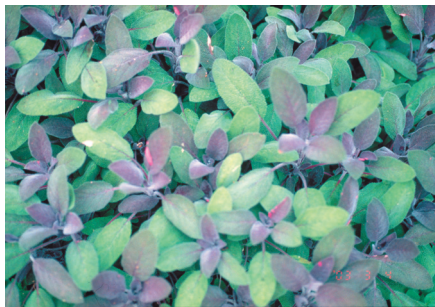
紫葉鼠尾草 ( Salvia officinalis 'Purpurascens Group') 應用: 抗菌助消化、婦女調經止痛藥、西餐料理常用的香料、製作沐浴用品。