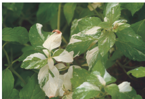
香蕉薄荷 ( Mentha × arvensis 'Banana'), 多年生草本植物，植株具香蕉氣味，節間較細密，葉片有絨毛。