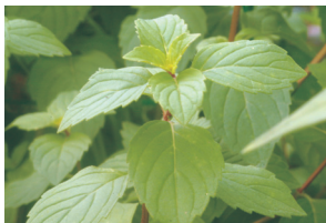
薑味薄荷 ( Mentha × arvensis 'Variegata'), 多年生草本植物，植株具薑及水果香味，冬季葉片較易形成黃色斑紋。