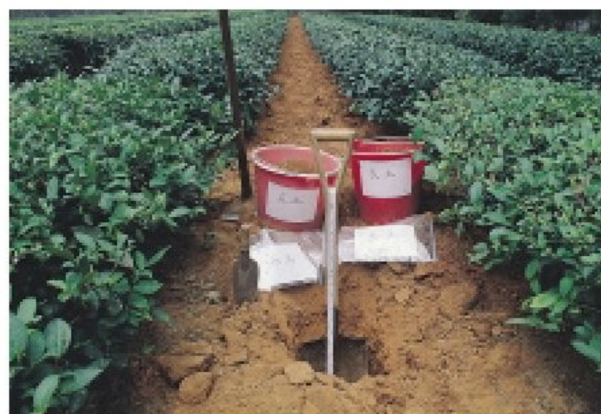
土壤取樣須依標準方法進行