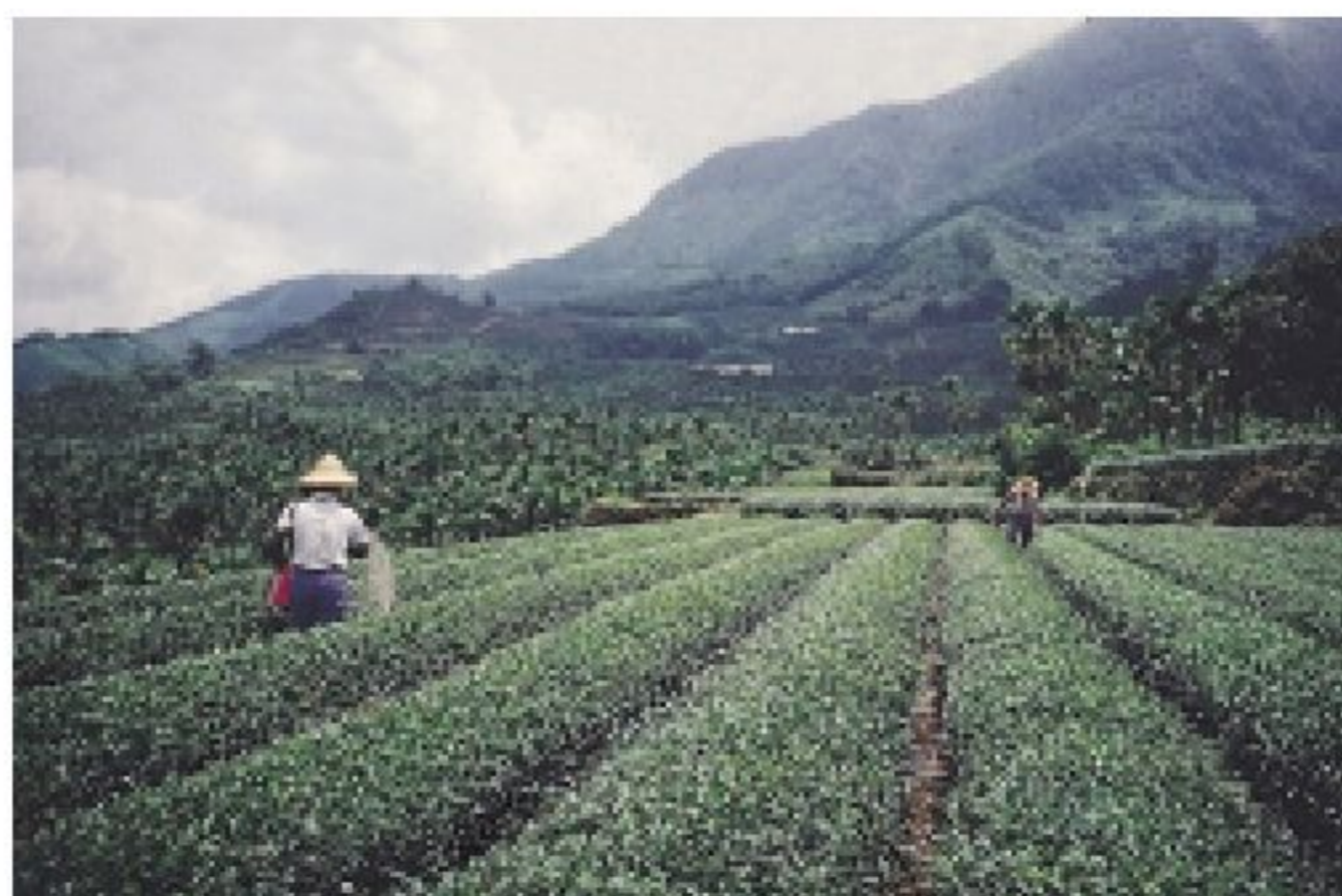
茶園合理化施肥可提昇茶葉競爭力

肥料是人類生存所需的寶貴資源，它需要被循環利用，特別是鉀與磷是開採礦石而來，有一天會完全用光，所以透過有機質肥料的方式來重複