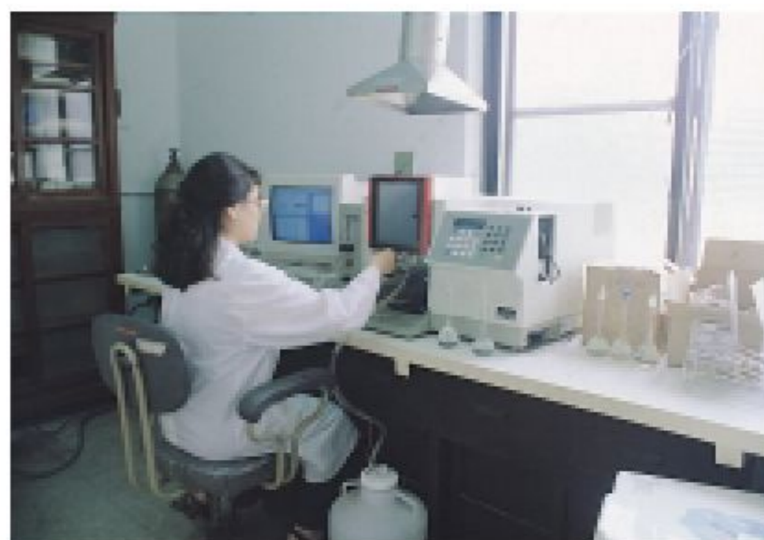
原子吸收光譜儀合理化施肥好幫手