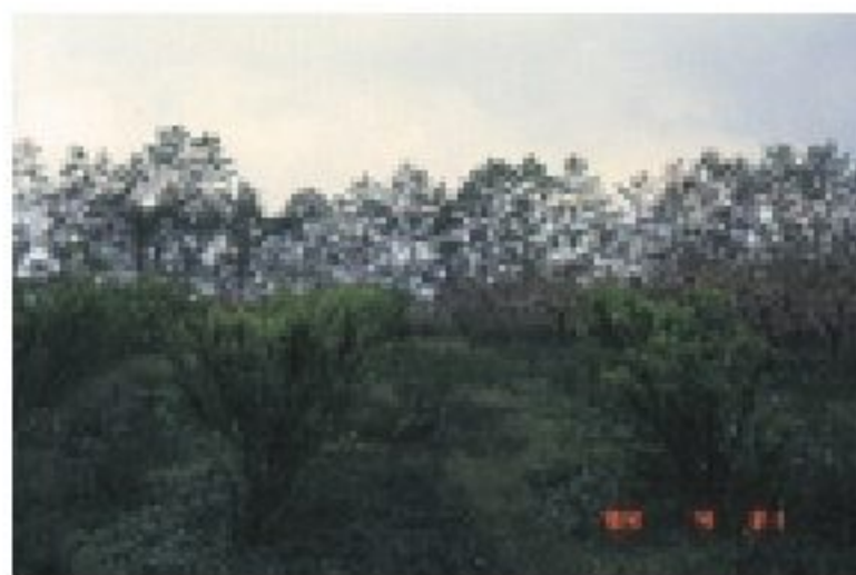
超密植之李樹果園

李果果色鮮豔，酸甜可口，具特殊李香，除可供鮮食外，另可製成李乾、李醬、李酒及蜜餞等加工品。果實中所含的成分包括：蛋白質、脂肪、維生素(A、B 1 、B 2 、B 5 、C)、礦物質(Ca、P、Fe、Na、K)及碳水化合物等成分，在