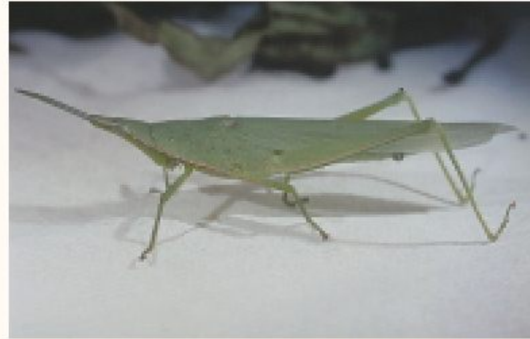
尖頭蝗體色呈綠色

成蟲皆可危害，終年可見到本蟲。體色呈綠色，棲息於具保護色的草叢。本蟲雖善於跳躍，但飛翔能力弱。主要以咀嚼式口器啃食葉片或切斷莖幹，影響光合作用。