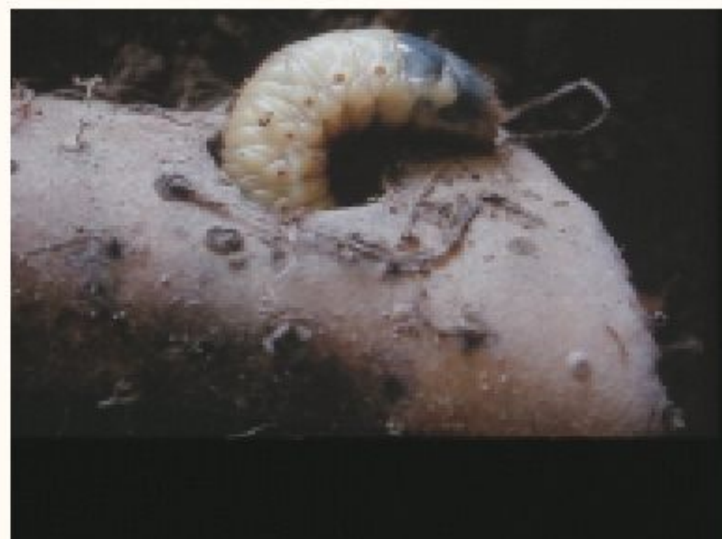
金龜子幼蟲危害塊莖部

此外，其幼蟲在根部附近的土壤中生存，並利用咀嚼式口器取食塊根，形成隧道在其中繼續蛀食，並將排遺堆於塊根表皮附近。最後老熟的幼蟲會在塊