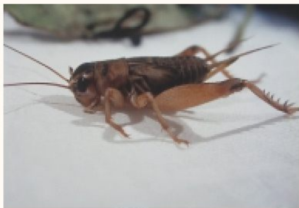
蟋蟀體色呈黑褐色並具有細絲狀觸角

本蟲為直翅目的蟋蟀科，俗稱「肚猴」，屬不完全變態。雄蟲可利用翅膀磨擦發聲，且其聽器在前足腳脛節上。體色呈黑褐色並具有細絲狀觸角，體型多呈圓桶狀，後足粗壯用以跳躍或迅速鑽入草叢或土洞中。夜間活動旺盛，會爬出土穴至地面活動，白天則潛伏在土穴中。