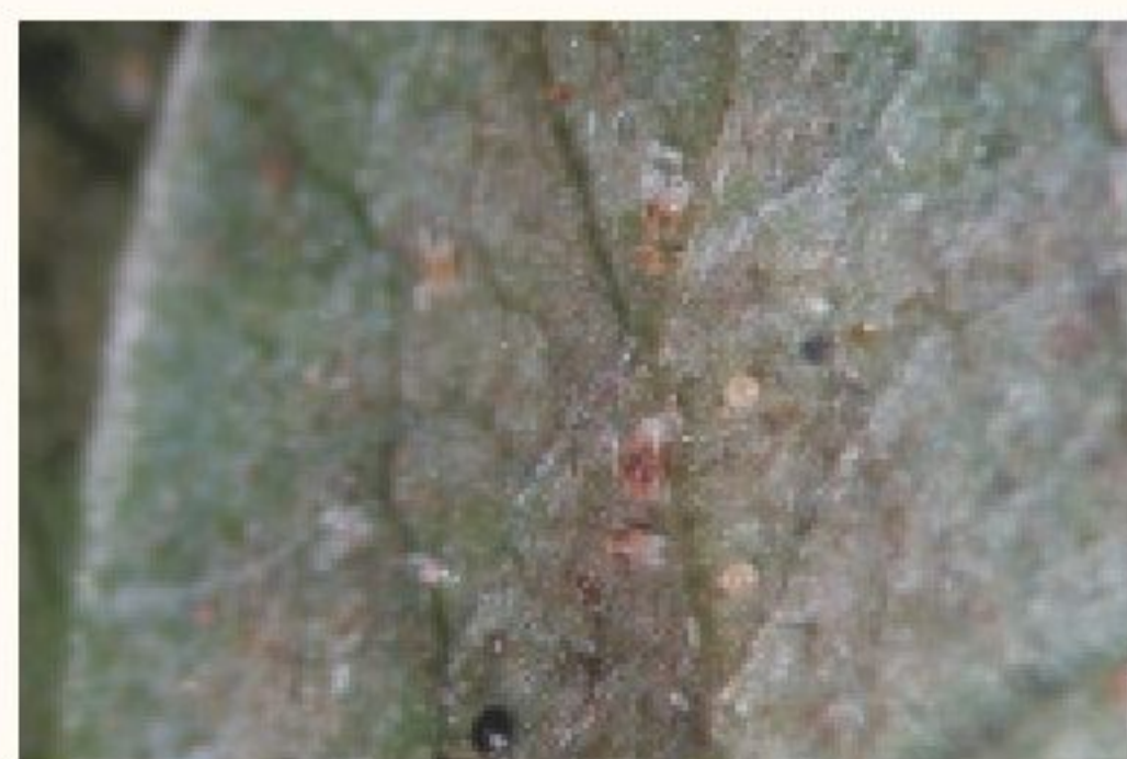
神澤氏葉蟎危害狀

卵產在葉表或附著於其所分泌的細絲上，呈很淡的桔紅色，具光澤，圓球形。發育至孵化前轉變為桔紅色，並有二紅色眼點。卵孵化為幼蟎，體淺桔紅色，足僅3對，行動較緩慢。幼蟎脫皮