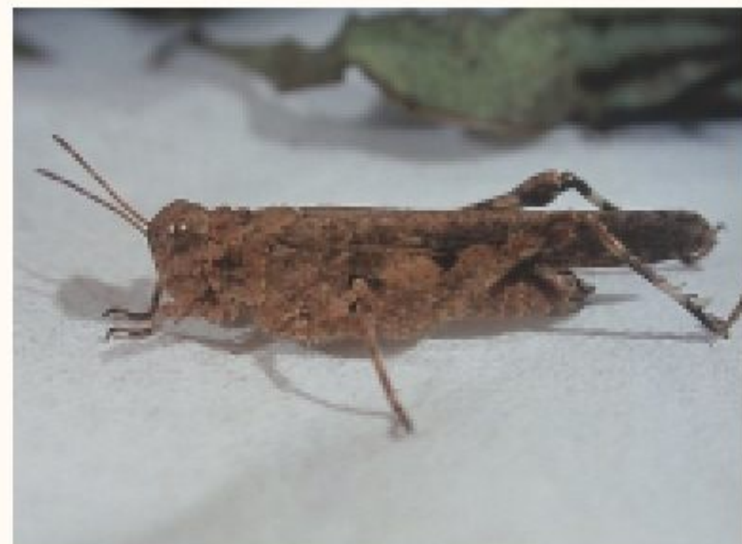
土背條蝗體色呈土黃色

本蟲爲直翅目的蝗科，也是不完全變態，從若蟲至成蟲皆可危害植株。其觸角呈短鞭狀，善於跳躍，體色呈土黃色，與土壤表面顏色相近而形成保護色。主要是以咀嚼式口器啃食葉片或切斷莖幹，除了影響光合作用外，甚而造成植株在幼苗期枯死。