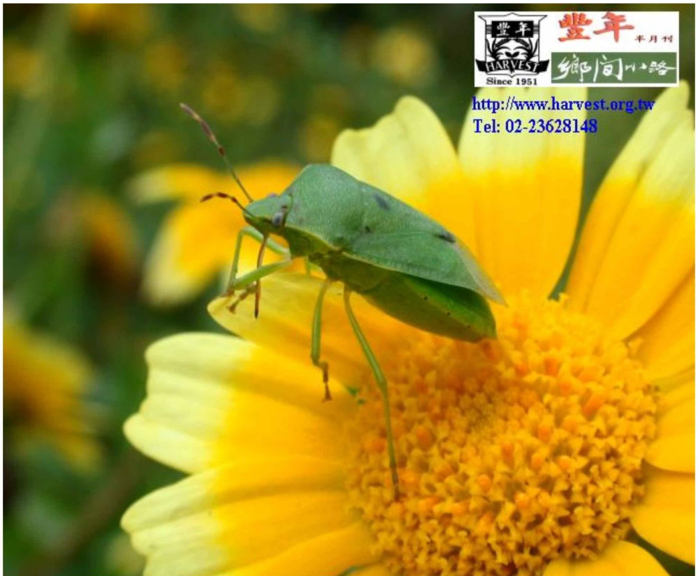
初春初、初月兩個多月的，田間土壤