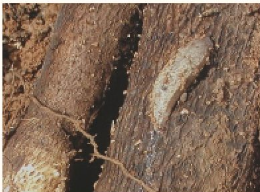
蛞蝓體背為灰白至灰色，全體被覆黏液

色。卵期為13~30天，孵化後個體細小，狀似成體。體背灰白至灰色，全體被覆黏液。蛞蝓白天藏身於潮濕的栽培介質處，到夜晚以取食靠近地基處仍然捲曲的嫩葉、新芽及根端等部位，造成不規則傷痕或孔洞，影響植株生長。或潛入塊根表面危害。除直接取食危害以外，並分泌黏液及糞便附著於塊根表面，影響品質。