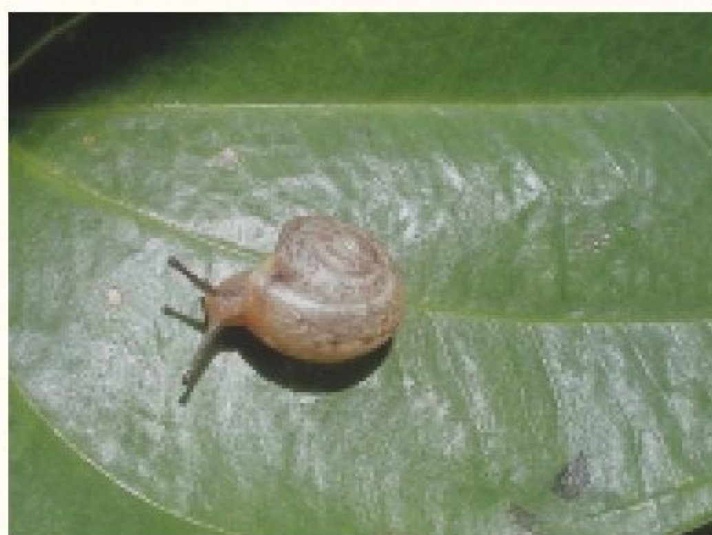
扁蝸牛體色呈淡黃褐色

卵呈圓形，其卵殼薄而易脆，起初為白色或乳白色，隨卵期發育而顏色逐漸加深。孵化後的幼蝸群集取食幼嫩組織，如嫩葉、新芽及根端等部位，造成不規則傷痕或孔洞。成蝸則分散加以危害其他植株組織，進而影響植株生長及品質。除直接取食外，扁蝸牛在植株組織爬動時，留在莖葉表面光滑的粘膜和排泄物，都會阻礙生育而造成間接為害。