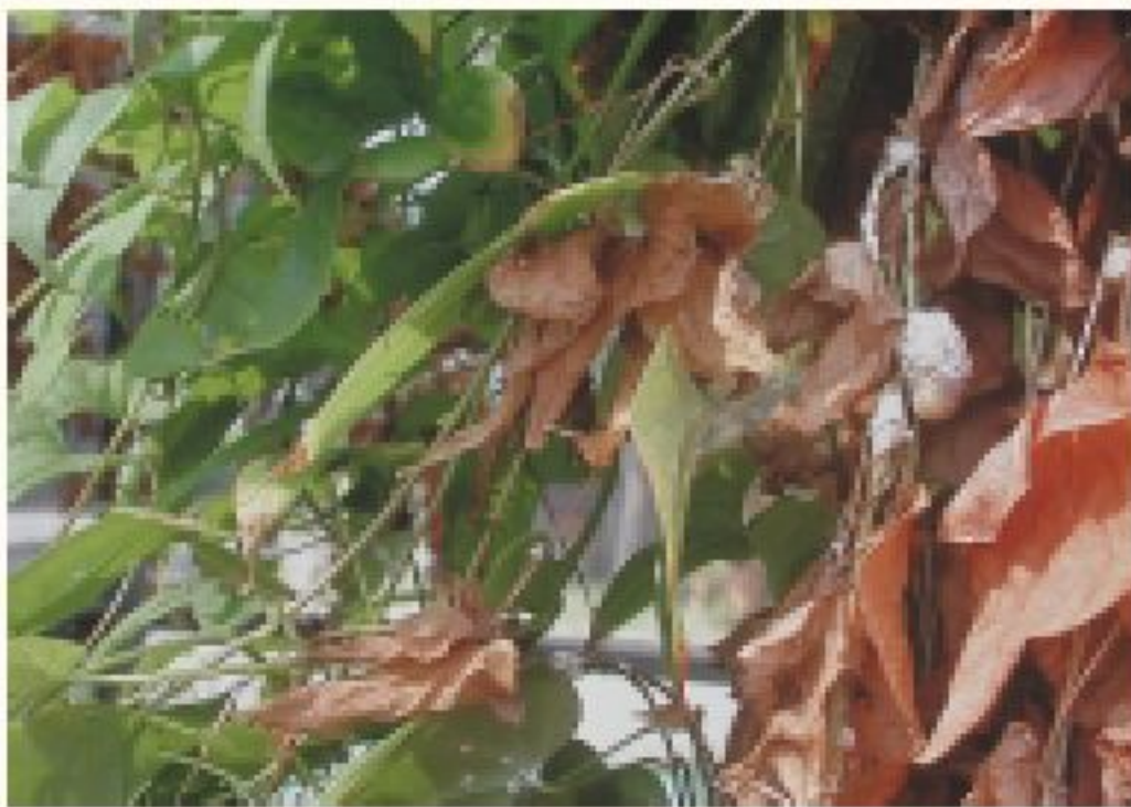
絲粉介殼蟲危害狀

本蟲爲粉介殼蟲屬同翅目，介殼蟲總科，粉介殼蟲科。雌成蟲體卵圓形，通常體表除背部中央外，覆蓋白色粒狀蠟質分泌物。尾端有二根長絲狀蠟物，常被誤認爲長尾粉介殼蟲。在葉、枝條、嫩梢和主莖上由中心受害植株向四周擴散危害，危害嚴重者枝條稀疏、葉片乾燥、幼芽和嫩枝停止生長。