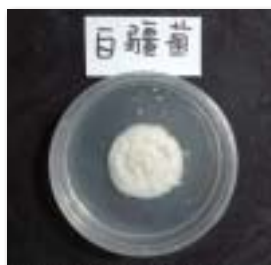
圖3. 白殭菌於人工培養基上生長情形，其分生孢子為白色。

目前，本場已應用放線菌與座殼菌等有益微生物，並添加燕麥、大麥、稻殼、蝦蟹殼粉等天然添加物，製備成生物性栽培介質(圖5)，可應用於防治蔬菜苗立