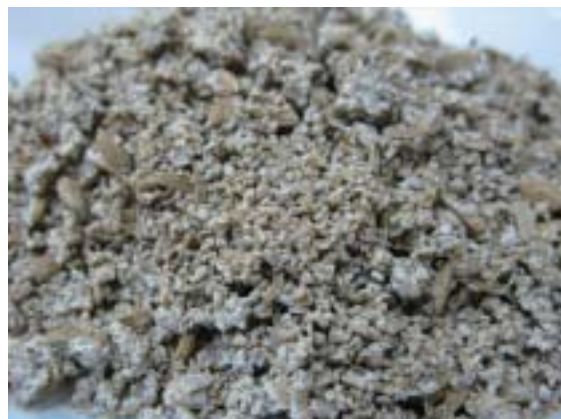
圖5. 本場研製放線菌、大麥、燕麥及蝦蟹殼粉等配方之生物性栽培介質。

隨著安全農藥與永續農業觀念的推廣，有益微生物的研究漸趨增加及深入，可預見生物性農藥市場規模將會逐年增加，定能減少化學農藥之使用，降低對生態環境之影響。台灣地區作物種類繁多，栽培管理方式多變，微生物資源豐富，對於有益微生物之開發，具有得天獨厚之優勢，相信未來必能成為安全農業的基石。