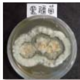
圖2. 黑腐菌之墨綠色分生孢子 (中央外層)