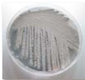
圖1. 放線菌外觀似真菌，於人工培養基上產生粉狀孢子。