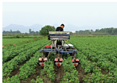
圖3. 多功能管理機附掛中耕除草施肥機具

規模，高雄場於2002年與台灣區冷凍蔬果工業同業公會（以下簡稱冷凍蔬果公會）及農機業者，共同遠赴日本及法國尋找適合台灣毛豆大農場使用的農機，陸續引進整地施肥播種機具、多功能管理機附掛中耕除草施肥機具及桿式噴藥機具、種子採收機等四種大型農機，再配合國內已有FMC7100型採收機，在高屏地區建立毛豆大農場機械化生產技術（圖1~6）。