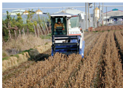
圖6. 毛豆種子採收機