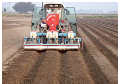
圖1. 曳引機附掛作畦真空播種機具