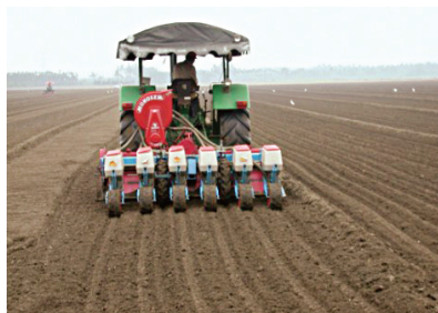
圖2. 曳引機附掛平畦真空播種機具