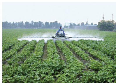
圖4. 多功能管理機附掛桿式噴藥機具