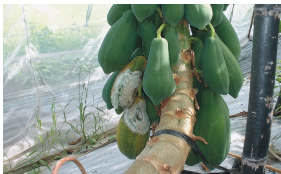
▲ 木瓜疫病果皮表面白色菌絲