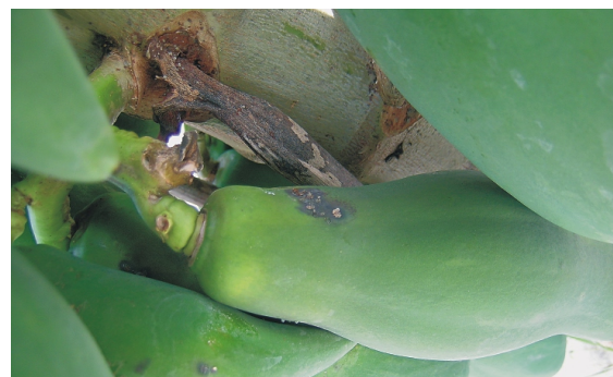
▲ 木瓜黑腐病造成果皮黑色角病斑