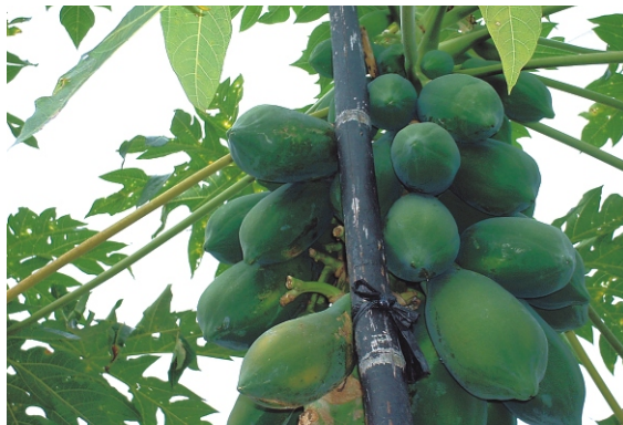
▲ 防風支柱固定不當果實易機械損傷