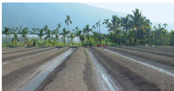
▲ 培土作高畦為木瓜防浸必要措施