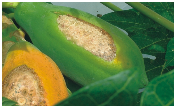
▲ 木瓜日燒曬傷影響商品價值