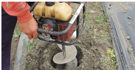
▲ 鑽孔穴施減少雨水將肥料淋洗流失