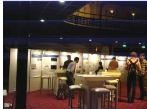
圖 26. TTI-GG 研討會場聯誼大廳