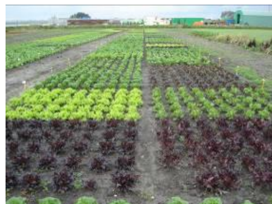
圖 6. 荷蘭園藝檢測服務中心之萵苣種原圃