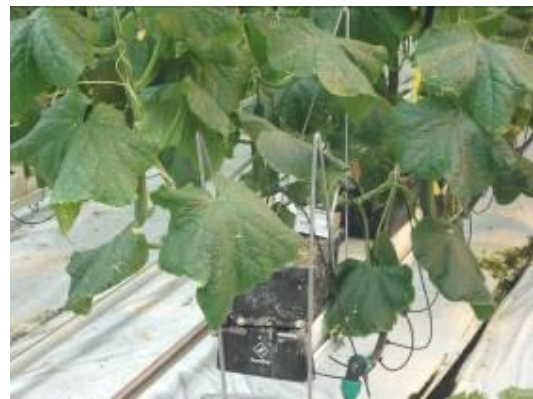
圖 22. 以蛭石為介質的盆栽系統