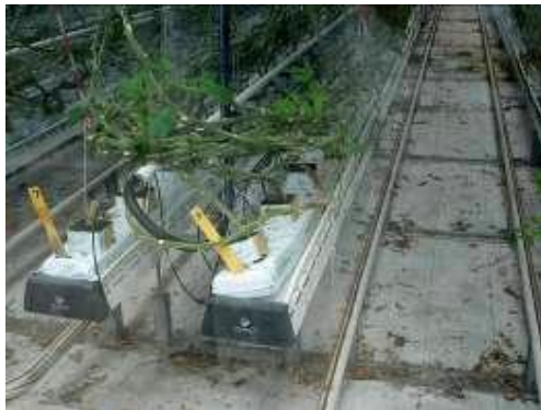
圖 9. 溫室無土栽培系統