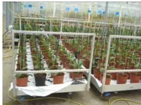
圖 18. 放置盆栽用之推車栽培槽