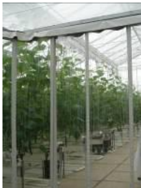
圖 11. 溫室生產區以雙重門簾防蟲