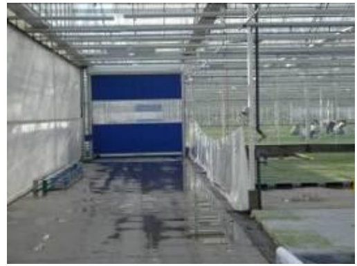
圖 14. 溫室中隔間用的塑膠捲簾