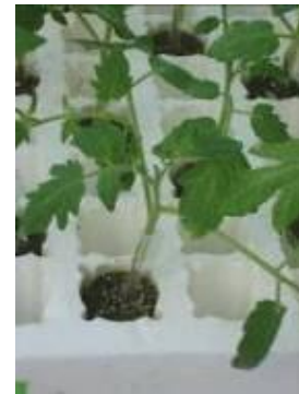
圖 16. 嫁接完成之番茄苗