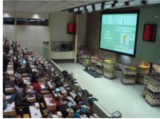
圖 2. 拍賣室