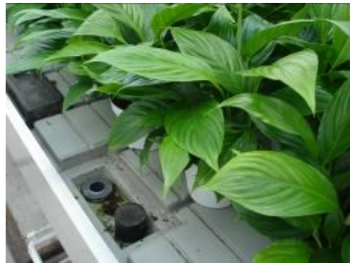
圖 10. 潮汐灌溉系統床架