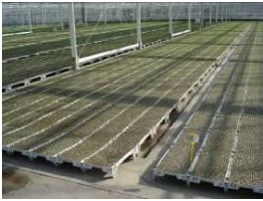
圖 13. 穴盤直接放置地上以塑膠腳架墊高