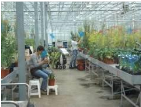
圖 17. 溫室盆栽十字花科蔬菜受粉

田間展示(field demo)的部份則在此試驗站的田區進行(圖 19)，展示超過 1,000 個品種。展示的目的主要是，邀集全球各地的種苗經銷商、育苗業者展示該公司的各類露地蔬菜作物品種，讓有興趣的下游廠商可以進一步接觸或瞭解品種的特性，以利品種的推廣。展示作物種類包含各類甘藍、花椰菜、青花菜、高苣、蔥科作物、胡蘿蔔、芹菜及各類菠菜廠商在展示期間會有專人引導介紹有興趣的作物種類，公司也會印製展示作物品種清冊(圖 20)，到訪廠商可直接記錄，並向公司進一步諮詢相關細節，同時也提供部分試作種子，供下游廠商在不同地區試種。