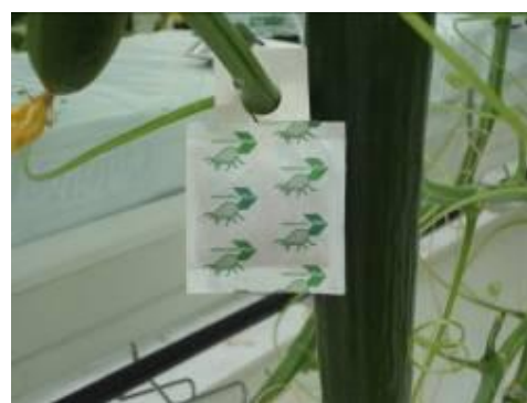
圖 12. 植株吊掛捕植蠅防治紅蜘蛛