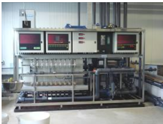
圖 23. 養液供應控制系統