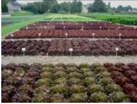
圖 19. Rijk Zwaan 田間展示