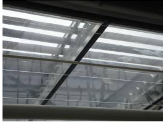
圖 8. 溫室屋頂以遮光板作為溫水集熱板