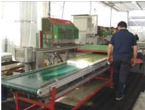
圖 15. 苗株影像選別系統操作情形