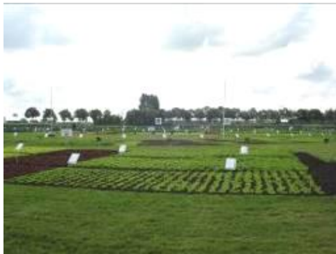
圖 25. Syngenta 田間展示會場

在研討會場外的聯誼大廳同時展示論文海報，可直接與研究人員討論，與國內之研討會或學會團體年會情況相似。不同的是，會場邀請參與計畫或研討會贊助之廠商設置攤位，並在聯誼廳中央的用餐區同時作為洽談區域(圖 26)。一方面增加相關廠商知名度，製造更多商機，並且讓相關業者及研究人員有更多接觸機會，互相尋求更多研究及商業資源。