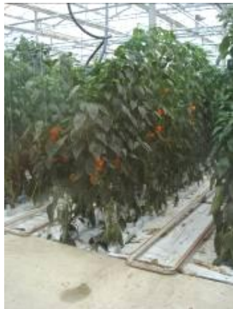
圖 21. 栽培系統直接設於地面，方便調查

其他溫室系統設施主要為冬季加溫系統及二氧化碳肥料系統，如同前述之因素，由於環保考慮，溫室加溫系統由以往的燃油系統改為燃燒天然氣。此能源供應系統在運轉發電時，同時將水加熱至 75°C 並貯存於保溫水槽中，燃燒天然氣產生的二氧化碳亦可收集作為氣體肥料，同時具有供電、保溫及供應二氧化碳的功能。