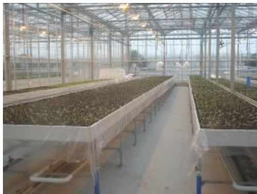
圖 24. 利用塑膠栽培床架進行各項檢定