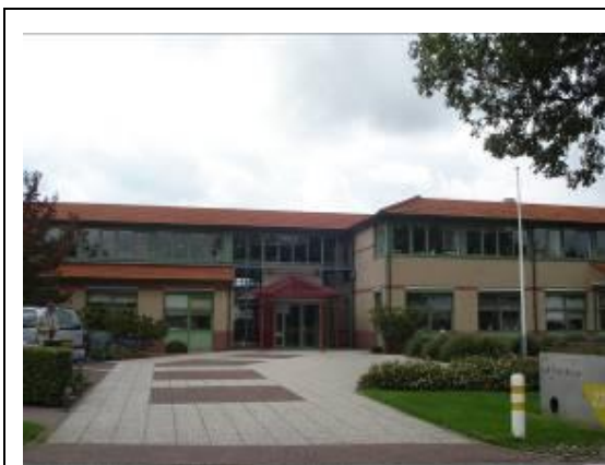
圖 5. 荷蘭園藝檢測服務中心(Nakytuimbouw)

Nakytuimbouw 另外一項比較特別的業務是接受委託進行訴訟報告，當業者間之交易涉及植物品種或材料的疑慮而訴諸法律仲裁時，例如委託繁殖或種苗交易時對產品的品種正確性有爭議，可委託該中心進行檢定，檢定報告可作為訴訟之合法證明文件，通常也會被法院採認。