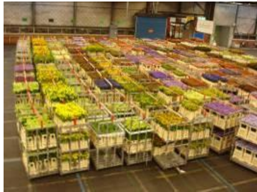
圖 3. 拍賣集貨場