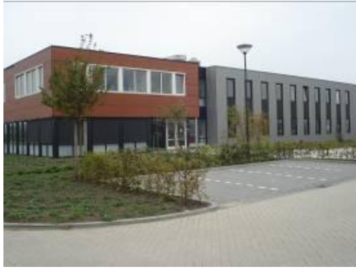
圖 7. Wageningen大學溫室園藝試驗站