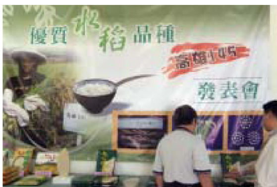
▲發表會深獲各界好評

水稻，介紹水稻的一生與栽培管理，同時也將此一優良品種推介給學童，達到宣導的效果。