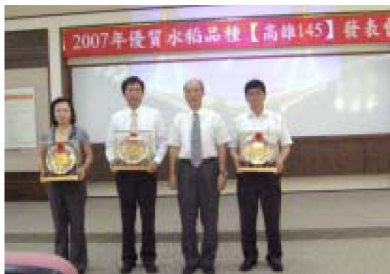
▲場長與輔導有功農會代表合影