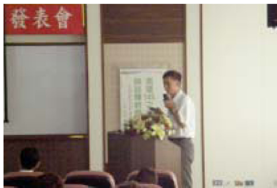
▲邱秘書主講高雄145之育成與品種特性

性」及「高雄145之推廣概況」專題報告，除介紹高雄145之雜交選育過程、各種特性檢定、生育特性及栽培注意要點外，也將命名後之推廣情形，向與會來賓進行詳細報告。優質水稻品種高雄145具有品質優良、良好產能、稻穀耐儲性佳、完整米率高、株型好、容易栽培等優良特性。自插秧至收穫之生育日數，第1期作為120天、第2期作110天。在合理化施肥之前題下，為考量氮肥之施用效益及過量施肥對環境造成的不良影響，栽培時請依各地區農業改良場推薦之肥料量施肥，施肥時應把握生育前期適時、適量施肥之準則，以增加有效分蘗數，發揮本品種產量之潛能，生育中期則應減少氮肥的施用，並厲行曬田以抑制無效分蘗、促進稻根活性。高雄145命名後隔年(94年)全台的栽培面積約達1,220公頃，95、96年栽培面積提升到2,000公頃以上，由於在各地區新品種示範期間(94~95年)高雄145米質表現優良，且具有耐白葉枯病的特性，故予以推薦為96及97年之良質米推薦品種。也因高雄145在米質方面的優秀表現，深受糧商及消費者的喜愛，更有糧商、農會與農民進行製作栽培，製作價格濕穀每公斤達新台幣9.5元，較一般良質米每公斤高1.5元以上；而一般糧商市面上之收購價，平均每公斤亦高出市價一成以上。因此，農民栽種此一品種，直接嘉惠稻農，實際收益至少增加10%以上。為培養學童重視米食、增加米食食用量及體驗農民種稻之辛苦，本場亦配合農糧署推行教學童種稻計畫，派員赴轄區國小輔導學童栽培