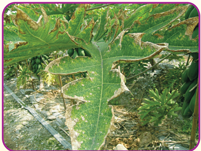
壤質砂土施用重肥或未腐熟之雞糞堆肥，易發生木瓜鹽害（葉緣焦枯）。