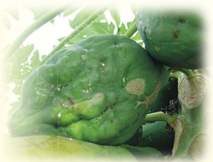
缺硼症嚴重果品喪失價值

微量要素中，木瓜對硼素極為敏感。植株缺硼易造成木瓜果實畸形，影響品質甚大，而在秋冬季節，具石礫之砂質地及偏強酸性土壤栽種之木瓜，易發生缺硼症（果皮凹凸不平似腫瘤）。其預防及改善方法，可於基肥施用時期，將硼砂（1~3公斤/公頃）與有機質肥料同時施入土壤，如木瓜果實已出現缺硼症狀，則可視需要適時、適量行葉面噴施進行改善，但須注意濃度不可太高，也不可每年施用，以免施用量過多造成毒害。若葉片植體營養檢測，硼含量低於20毫克/公斤，或土壤肥力檢測硼含量低於0.25毫