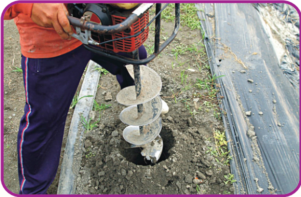
利用簡易鑽孔機，進行雨季前追肥穴施作業可減少肥料流失。

土。其他時期則掀開畦面之敷蓋物，將肥料均勻撒施於畦腰後覆土，再將畦面敷蓋。此外，如需於梅雨季節來臨前1~2週，進行追肥施用者，可利用簡易鑽孔機，在樹冠四周鑽4~6個孔穴，直徑15~20公分，深約40~50公分，然後將調好之有機質肥料或化學肥料分層埋入，並加以覆土，可減少雨水沖刷，造成肥料流失。