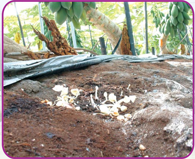
未發酵完全之堆肥於土壤中進行後續發酵，不利於木瓜幼根生長，且發酵過程將會消耗土壤中部分氮源。

在合理施肥管理上，有機質肥料佔相當重要的角色。施用有機質肥料能提升土壤中之有機質含量，並供給作物養分、活化土壤微生物相、增加保肥、保水能力、促進土壤團粒及土壤緩衝作用等功能。因此，充分施用有機質肥料，對提昇果實品質有極大的效果，不僅可提高甜度、口感佳而且較耐儲藏。但在選擇上，需使用經堆肥化發酵腐熟完全之有機質肥料。而最常用之有機肥料可分為禽畜糞堆肥及雜項堆肥兩大類，在選擇上可依土壤pH之不同進行選用。以酸性土壤而言，建議使用pH值偏鹼性的禽畜糞堆肥，除可改善土壤物理性質外，亦可提升土壤pH值。而鹼性土壤則建議使用富含豆粕類之雜項堆肥，因其分解