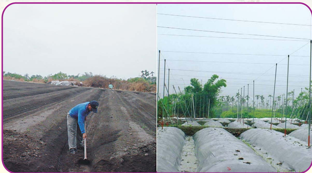
木瓜田區需排水良好並作高畦防浸水

另外，一般選地栽植木瓜，多數選擇排水良好之壤質砂土、砂質壤土或壤土，進行木瓜栽種，但不同土壤質地之保肥能力也有所差異。一般而言，土壤質地孔隙越大者，其保肥能力越差。就以排水良好並適合栽種木瓜之土壤進行比較，其保肥能力：壤土 > 砂質壤土 > 壤質砂土，而施肥方式與次數，則依土壤質地之不同而有所差異。以保肥能力較差之壤質砂土為例，全量肥料之使用，則需分多次少量施用，以避免土壤對肥料之緩衝能力不足，造成植物體鹽害（肥傷）與肥料的流失。