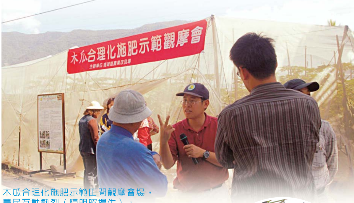
木瓜合理化施肥示範田間觀摩會場，農民互動熱烈。

此田區分為農民慣行施肥方式（簡稱慣行區）及合理化施肥示範方式（簡稱推薦區）進行比較，農民慣行區木瓜定植1800株/公頃，而其施肥量為農民多年之施肥習慣，其施用肥料換算量為 N:P_2O_5:K_2O=484:686:650 ，換算為硫酸銨、過磷酸鈣及氯化鉀，總價約34,300元/公頃/年。而推薦區之施肥量為依據土壤肥力檢測及植物體營養診斷之結果進行推薦，並於木瓜定植後一週，以中興大學免費提供之溶磷菌稀釋300倍噴灌木瓜根域，並於每3個月補充噴灌1次，而其化學肥料施用量換算為 N:P_2O_5:K_2O=180:300:240 ，肥料施用總價約13,700元/公頃/年。二者比較，推薦區較慣行區之化肥用量，約可減少60%之施肥成本。