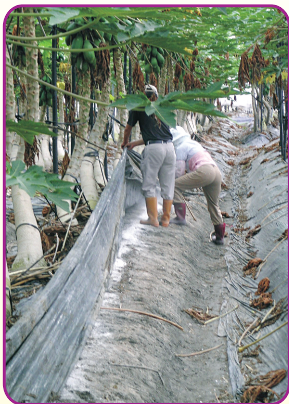
施肥過量易造成田間土壤鹽分累積與酸化

台灣加入WTO後，市場貿易自由化，肥料價格亦隨物料成本起伏而波動，使得農業生產成本，有逐年升高之趨勢，因此推動作物合理化施肥，即成為政府近年來之重要政策。而其真正意涵，簡單的說就是『當用則用，當省則省，科學施肥』。然而，所有作物生長發育及養分吸收，均與土壤有著密不可分的關係。因此，做好土壤管理，提高施肥效率是合理化施肥之重要目標。在做法上，除了適地、適作外，更要綜合考慮氣候因素、土壤、肥料及作物營養等特性，並配合土壤肥力檢測與葉片營養診斷，適時、適量、適法施用肥料為最高指導原則。