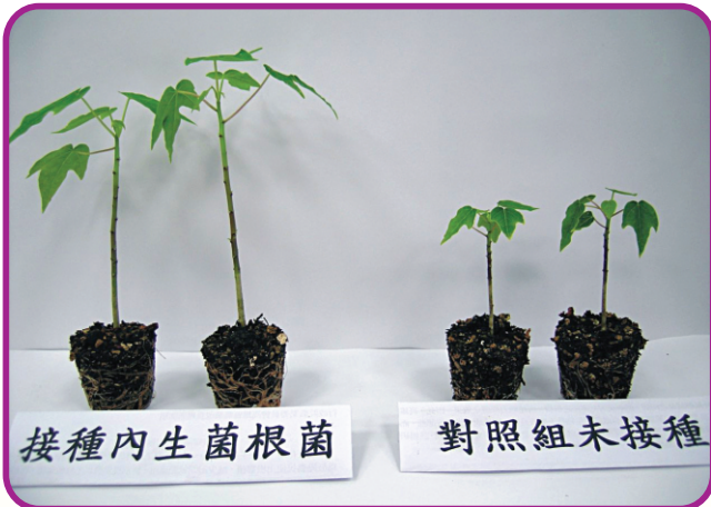
接種內生菌根菌之木瓜苗具有較佳之生長勢

接種內生菌根菌，使其互利共生形成菌根，將能有效促進木瓜幼苗根系生長，提升定植階段幼苗移植存活率，除節省缺株補植之支出外，而植株更可藉由菌根之根外菌絲，擴大根系之磷肥吸收範圍，增進養分和水分之吸收，並提高抵抗逆境之能力，且提早花芽抽出率15~20%，增進果實產量。並且具有促進土壤團粒形成，改善土壤性質和增強對土媒病原菌之抵抗性。但在育苗接種菌根菌階段，栽培介質中之磷肥含量過高，將不利於菌根菌與作物間形成良好共生關係。抵抗逆境之能力，且提早花芽抽出率15~20%，增進果實產量。並且具有促進土壤團粒形成，改善土壤性質和增強對土媒病原菌之抵抗性。但在育苗接種菌根菌階段，栽培介質中之磷肥含量過高，將不利於菌根菌與作物間形成良好共生關係。