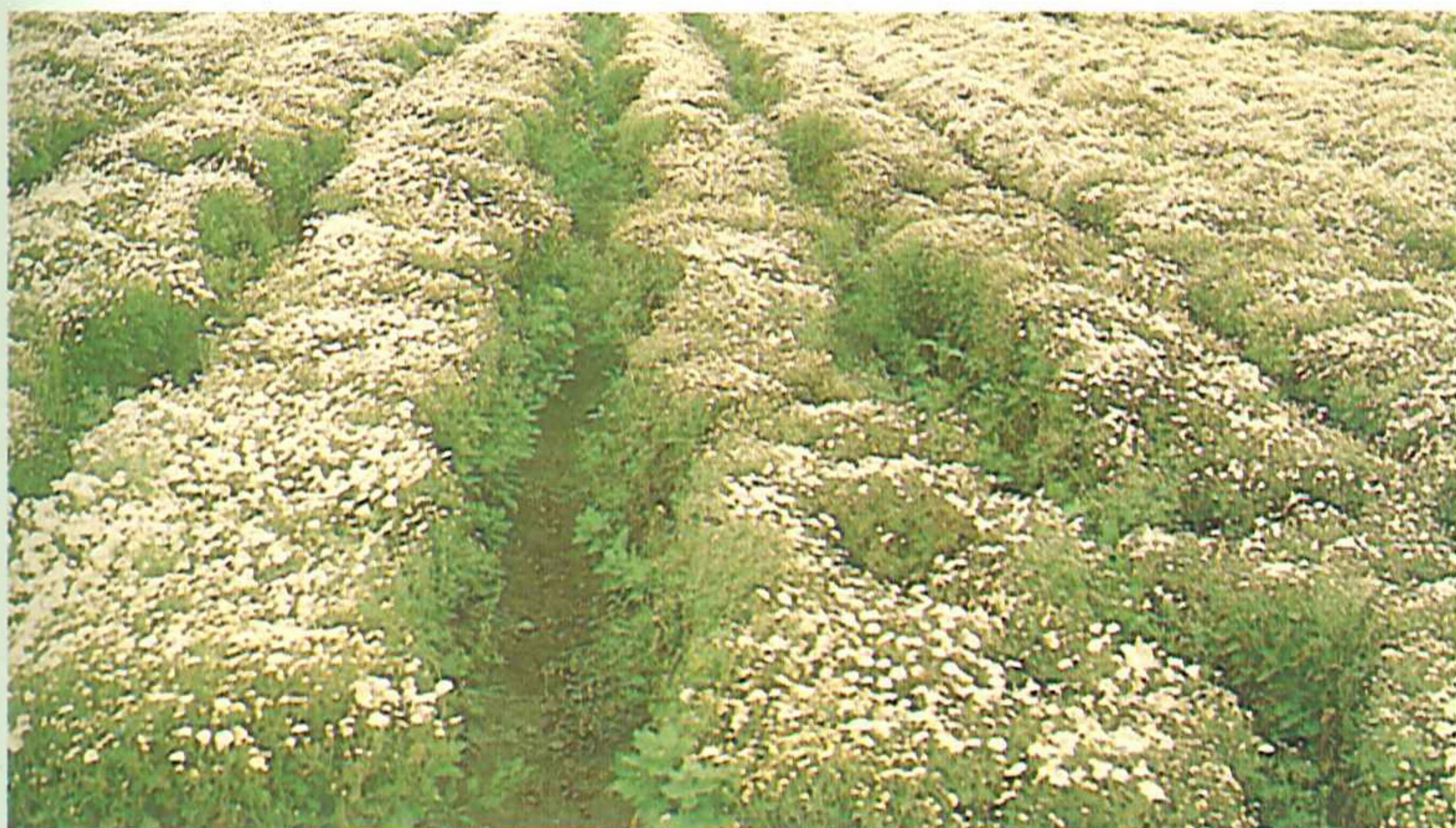
一般以雙行畦栽培杭菊，利於管理與採收